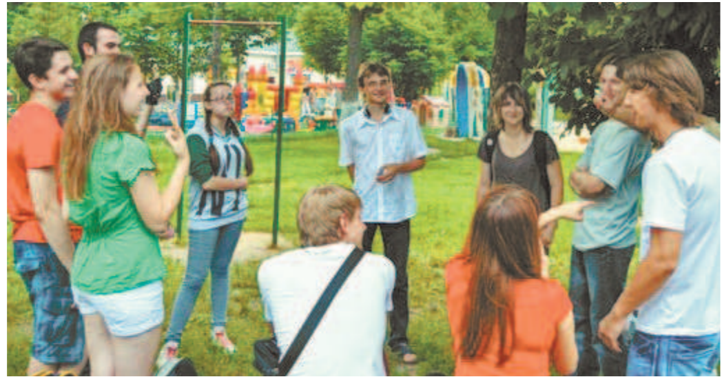
Орловские соционики встречаются несколько раз в неделю

Оказалось, что психотип «Гексли» встречается довольно часто — среди ор-