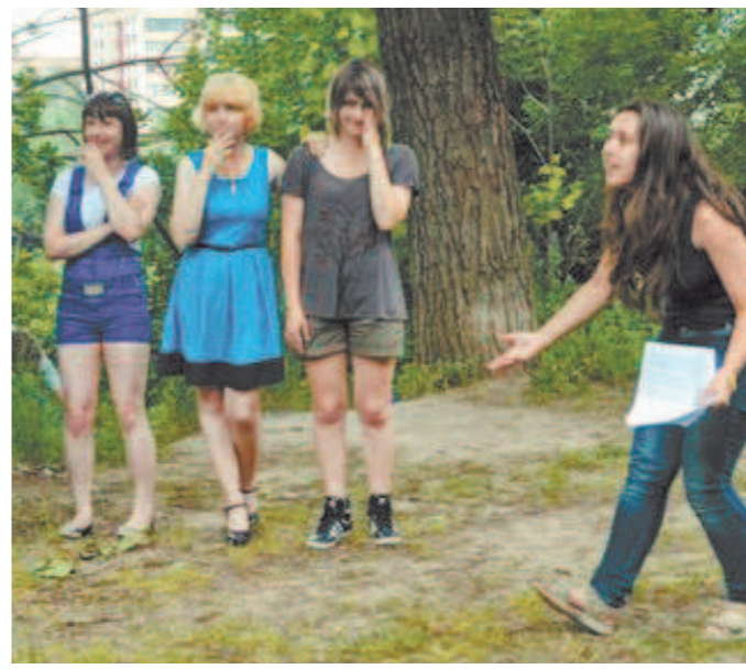
Участницы Клуба любителей соционики разыгрывают сценку «Алиса в Стране чудес»

стников, или думают, что лучше разбираются. Молодости свойственен максимализм в суждениях.