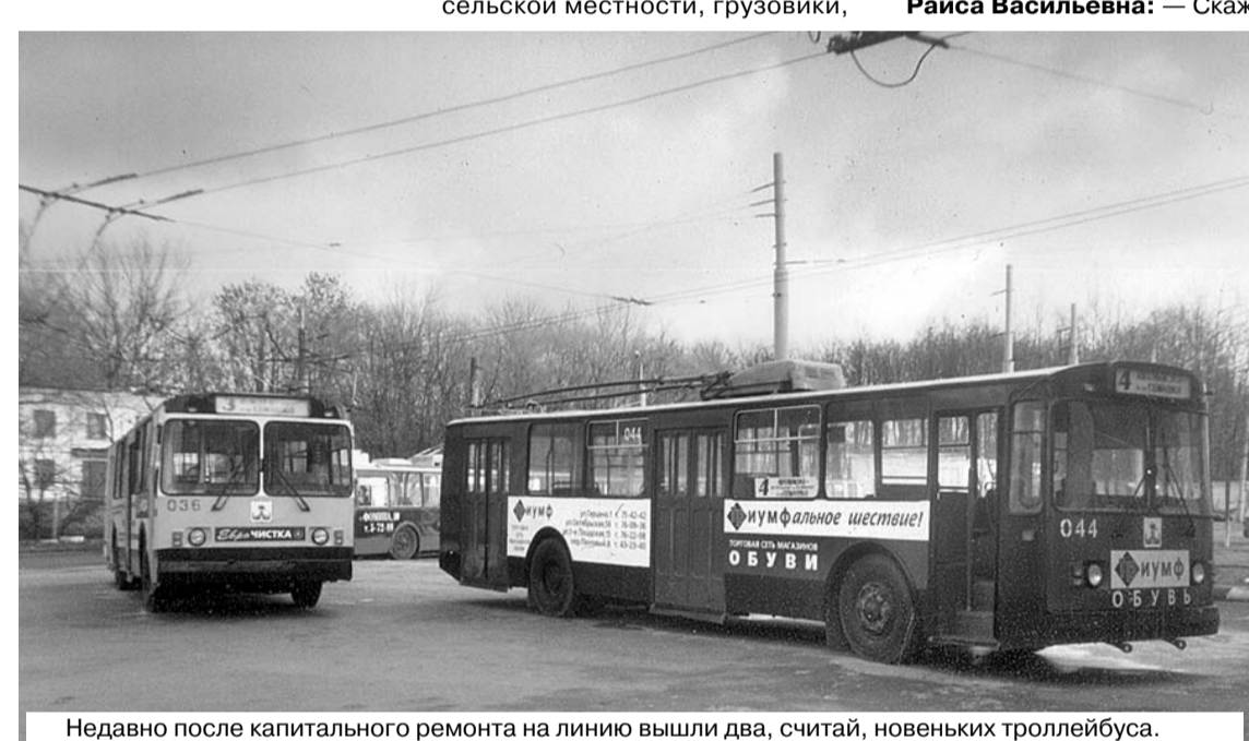
Недавно после капитального ремонта на линию вышли два, считай, новеньких троллейбуса.

А.Я. Коровин: — При нормальном уровне финансирования работы на вашей улице мы начнем выполнять в конце 2005