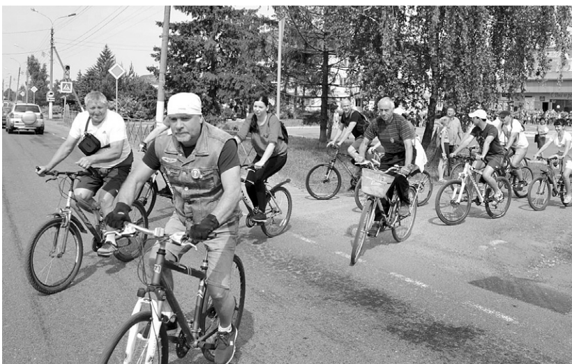
Ежегодный велопробег собирает сотни любителей спорта