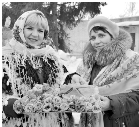
Празднование Масленицы в посёлке Нарышкино

В рамках национального проекта «Образование» Бунинская школа стала участником программы по созданию центров образования цифрового и гуманитарно-го профилей «Точка роста» в рамках мероприятия «Обновление материально-тех-нической базы для форми-рования у обучающихся со-