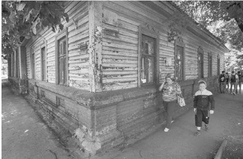
Новый старый Орёл — цивилизованный и «дикий»

Для выполнения работ по покосу травы на вышеуказанной территории в адрес