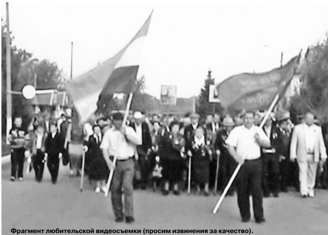
Фрагмент любительской видеосъемки (просим извинения за качество).