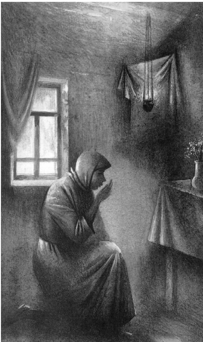
Иллюстрация из книги Ивана Рыжова "Встреча". Художник Николай Силаев.

Новое время, его душевная сухотка, его духовная анемия