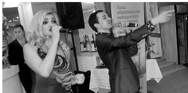
Матерей поздравили лучшие орловские артисты