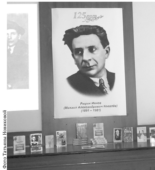
Творчество Юрия Иванова на удивление многогранно