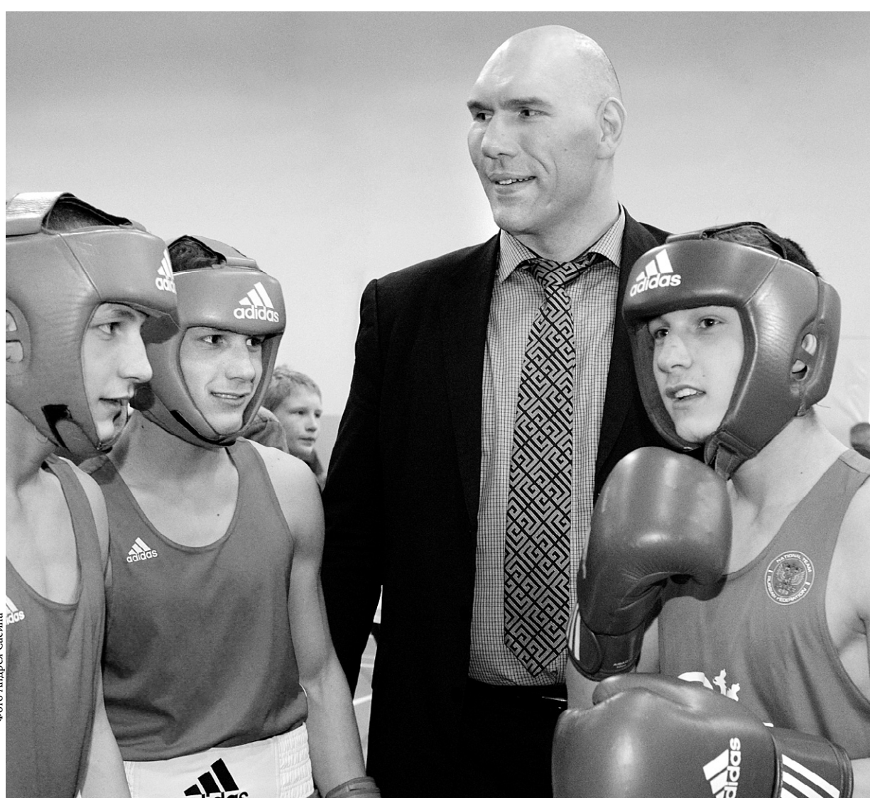
Николай Валуев: — Ты будешь стоять на олимпе, если готов всё отдать ради этой цели

Я к тому моменту хотя и был уже мастером спорта, но в профессиональном боксе только третий год выступал. Конечно, знал, что та-