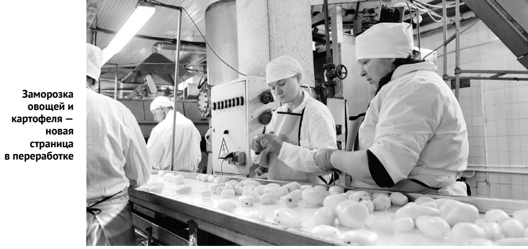
Заморозка овощей и картофеля — новая страница в переработке