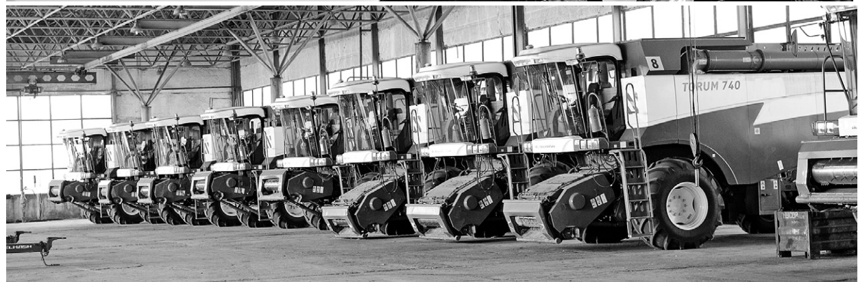
В этом цехе ОАО «Агрофирма «Мценская» комбайны стоят под крышей