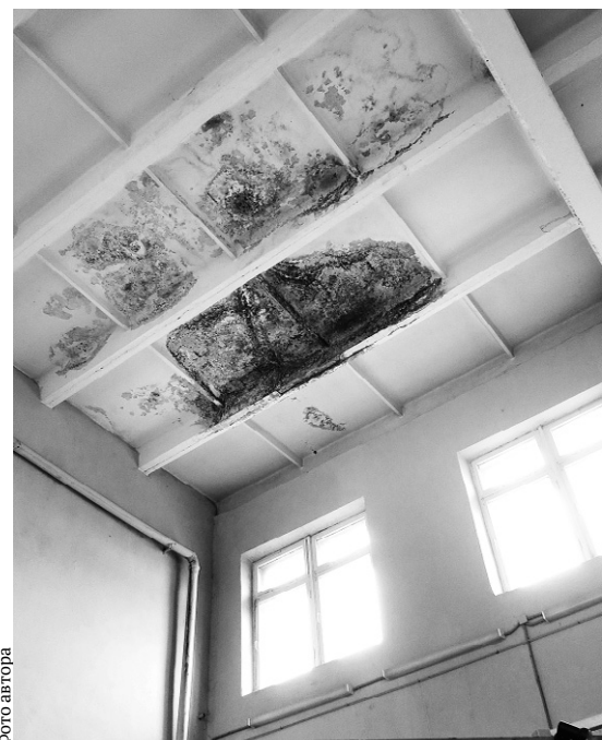
Крыша выставочного зала — в плачевном состоянии