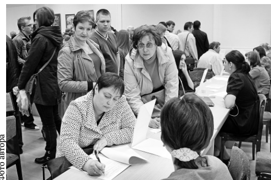
Ярмарка вакансий — реальный шанс найти работу