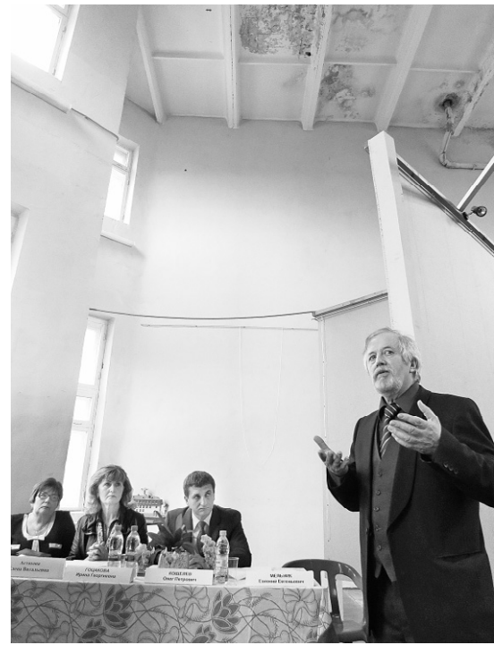
Кто же поможет орловским художникам?