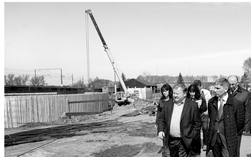
На этом месте скоро будет новое зернохранилище

нов с маркой «Ростсельмаш». — Машина неплохая, но вот жатка, — бросает в сердцах Жернов. — Не довели её до ума, мучаются с ней комбайнёры.