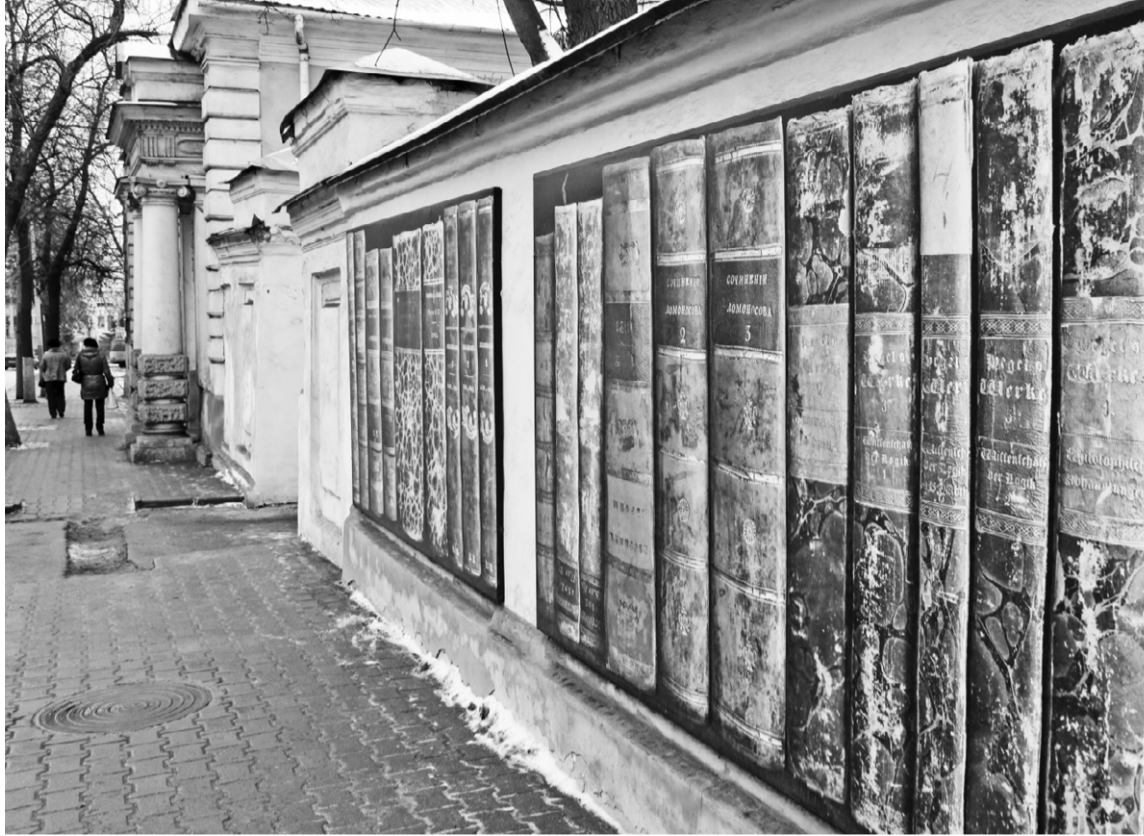
Немного фантазии, и рисунок на заборе — факт искусства

Потом была приятная встреча с «книжной полкой» на остановке «Музей Тургенева». Вместо скучного тусклого забора на тебя смотрят цветные ко-решки благородных ста-