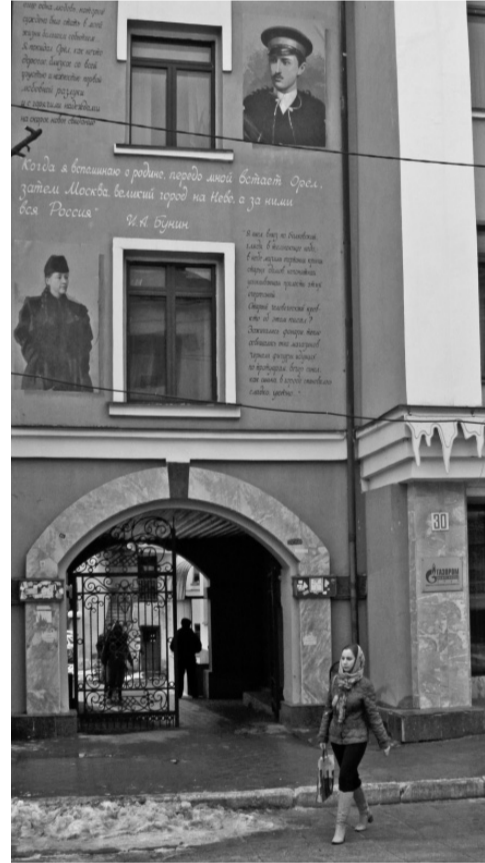
Спустя годы Иван Бунин вернулся на бывшую Болховскую улицу