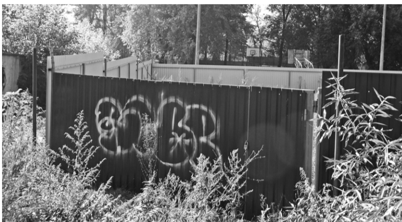
Пока судьба будущей стройки в тумане...

На днях за неисполнение решения суда судебный пристав-исполнитель вынес постановление о взыскании с горсовета исполнительского сбора в сумме 50 тысяч рублей. Чтобы доказать свою