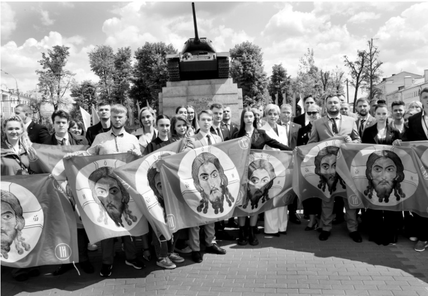
Участники конкурса на всероссийской акции «Эстафета Победы» в сквере Танкистов

ленной номинации «Политпросвет», направленные на развитие электоральной культуры и правового просвещения участников избиратель-