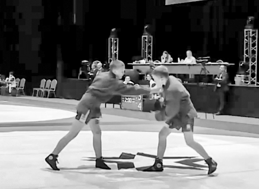
Момент открытия чемпионата страны