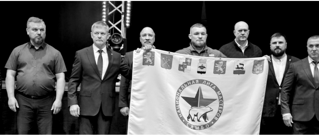
Победы в Великой Отечественной войне.

Оба турнира самбистов — и взрослый, и детский — были приурочены к 80-й годовщине