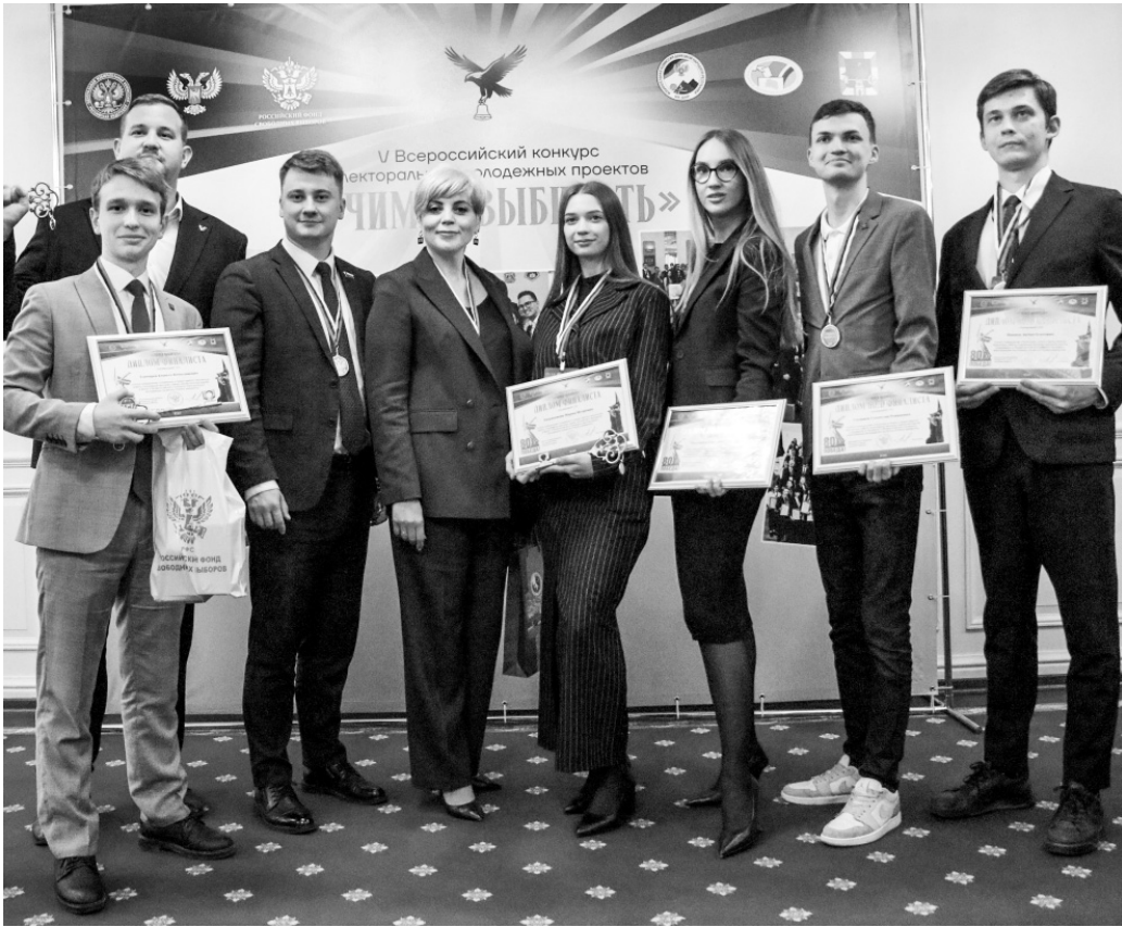
Лучшие молодёжные идеи будут использованы для развития избирательной системы страны

Во второй конкурсный день молодые люди делились своими разработками на площадках литературных залов конгресс-холла ТМК «Грин». Проекты в самой многочис-