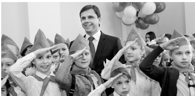
НАСЛЕДНИКИ СЛАВНЫХ ДЕЛ СТРАНЫ Стр. 4