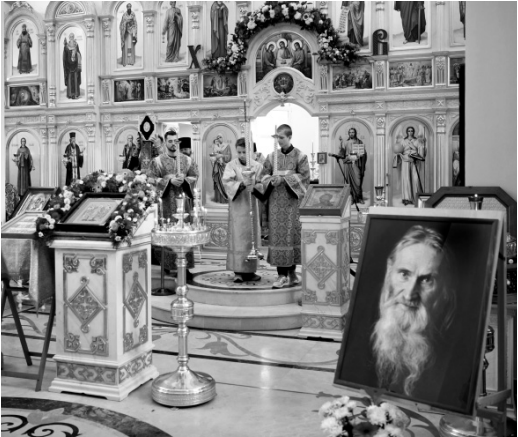
Праздник добра, единства, верности традициям

Все выступавшие отмечали особое значение схиархимандрита Илия (Ноздрина), ставшего основоположником и вдохно-