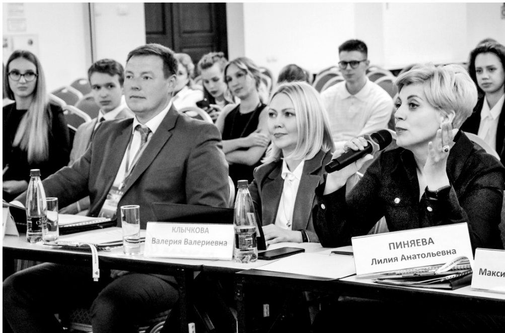
В составе жюри — опытные эксперты