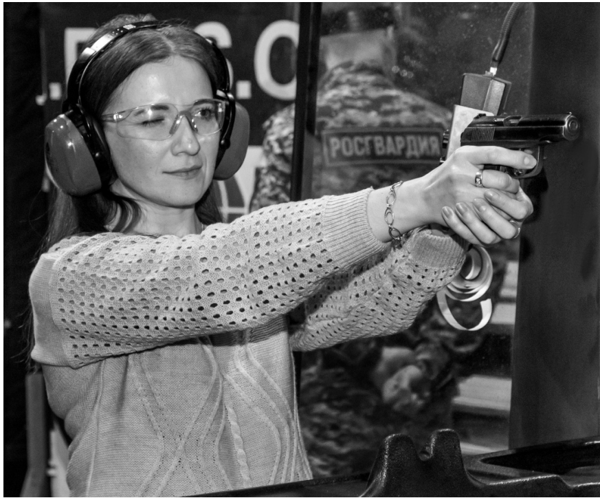
Орловские журналисты на турнире по стрельбе достойно показали своё мастерство