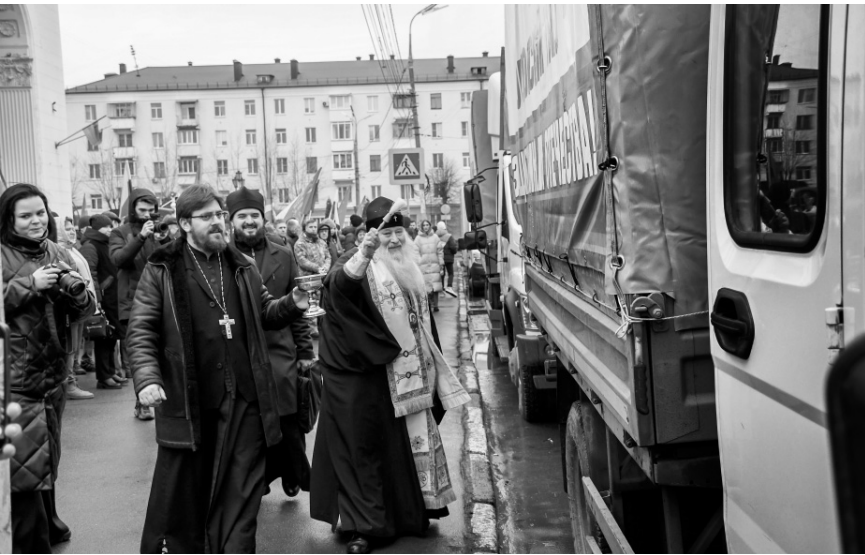
Гуманитарку из Орловщины везут семь машин