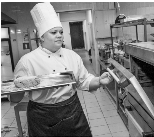
Испечь «блокадный» хлеб — дело непростое