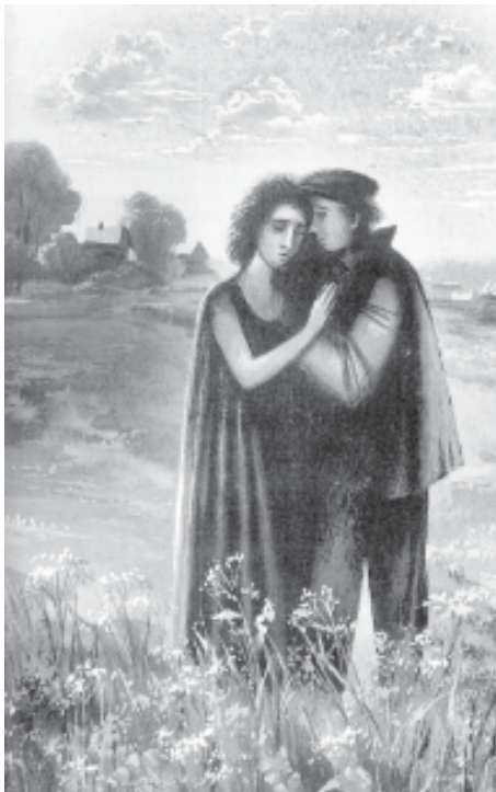
Иллюстрация Н. Силаева из книги И. Рыжова «Встреча».