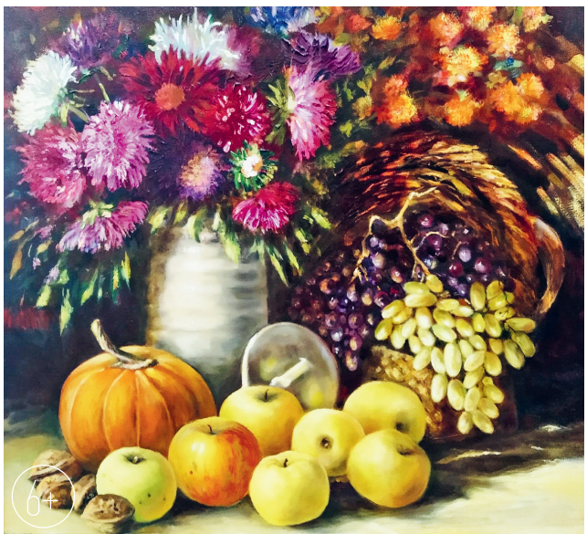
Р. Д. Федотова. «Осенний натюрморт»