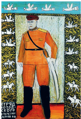
таких как «Огонёк», «Коммерсант», «Raw vision».

Необычный стиль его работ характеризуется сочетанием больших и малых фигур, а также «разбиванием» плоскости картины на отдельные квадраты, своеобразные «телевизоры», в которых разворачиваются различные сцены. Картины