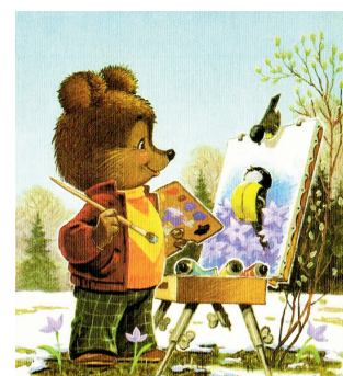
«С праздничкой Снегурочкой!»

ских музыкантов», «Сказка о царе Салтане» и многих других. А всего на его счету более 100 мультфильмов!