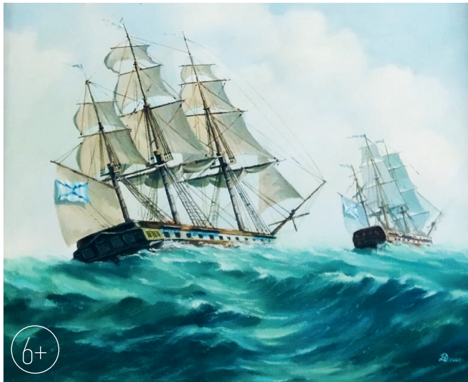
Д. А. Назаров. «Свежий ветер»