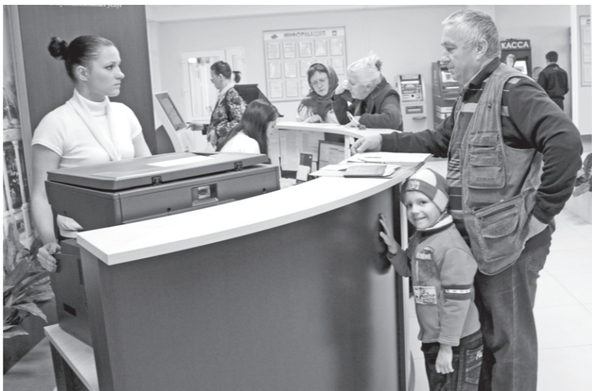
Сегодня в МФЦ жителям Орловщины оказывают 191 услугу

Губернатор Александр Козлов: — В 2013 году предстоит увеличить расходы бюджета на создание электронного правительства, расширение географии обслуживания, на расширение списка услуг, которые будут предоставляться в электронном виде