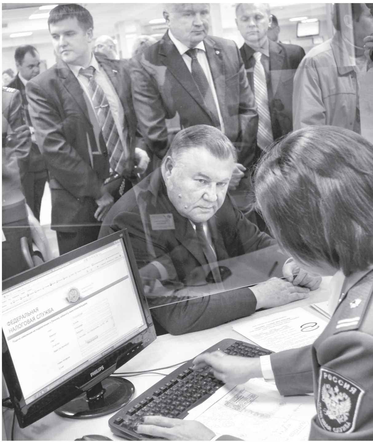
Александр Козлов: — Будем стараться, чтобы люди в каждом населенном пункте нашего региона имели возможность вот так, без очередей, получить государственные или муниципальные услуги

В самое ближайшее время такие же центры должны появиться во Мценске и Ливнах.