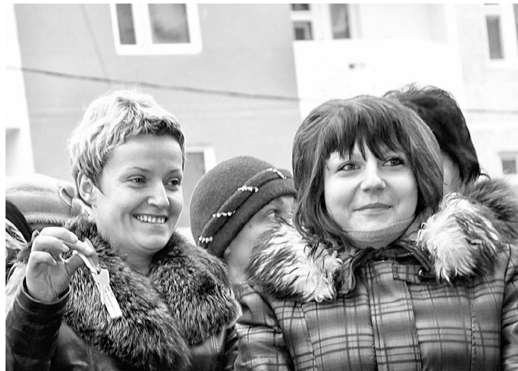
Вручение ключей от квартир детям-сиротам в микрорайоне Ботаника (2011 год)

По Орловской области таких данных нет, и все же наши полицейские не раз приходилось заниматься расследо-