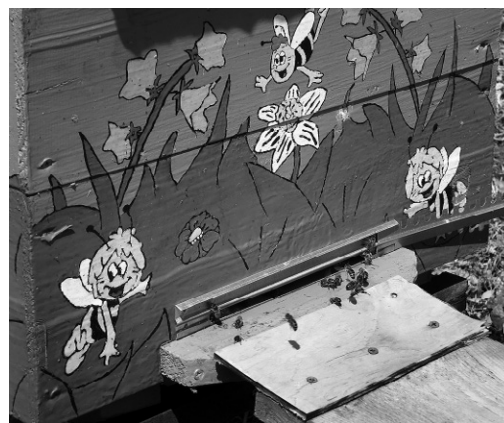
В такой нарядный улей пчёлы летят с удовольствием

чтобы с этой скотиной возиться. А она — ни в какую. Какой же это деревенский дом без коровы-кормилицы?