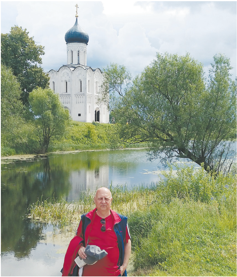
Наш читатель побывал в храме XII века Покрова на Нерли

Обедали орловско-брянские туристы в ресторане «Старый город». К полноценному вкусу