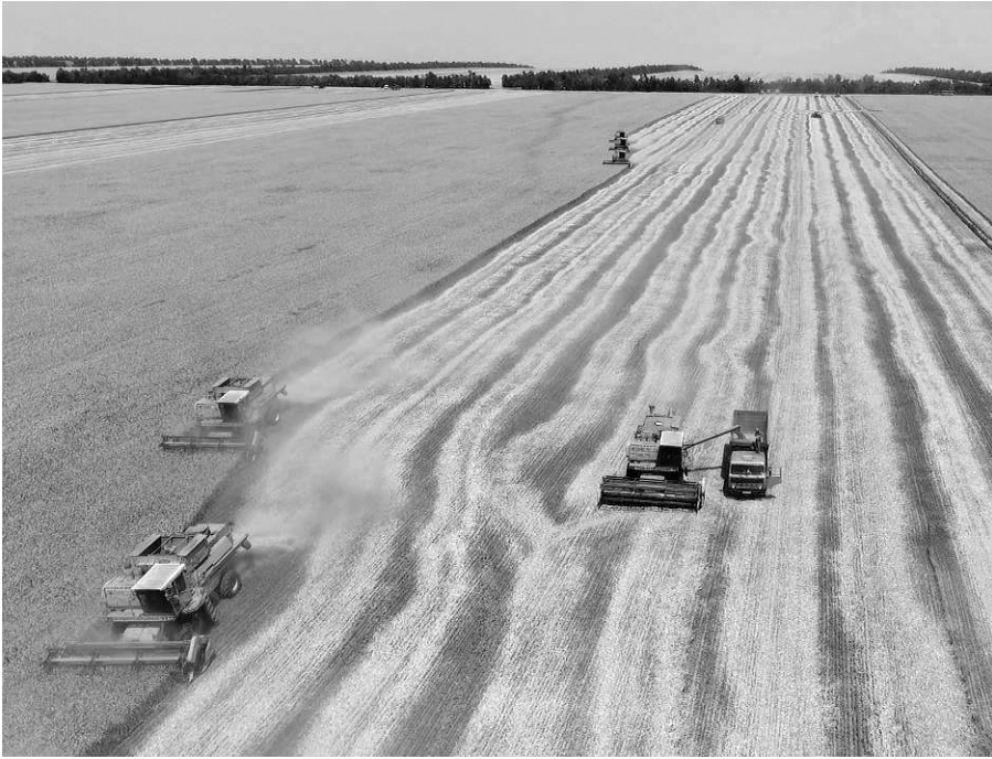
Уборка на орловских полях

— Да какие там опасения, — с видом умудрённого человека отвечает он. — Всё идёт своим чередом. Убирать начали в хорошем ритме. В день до тысячи тонн зерна доставляли с поля на склады. Потом дождь, на пару дней остановка. А что вы хотите? Идеальных условий у крестьянина никогда не бывает. За 46 лет работы на посту руководителя этого хозяйства