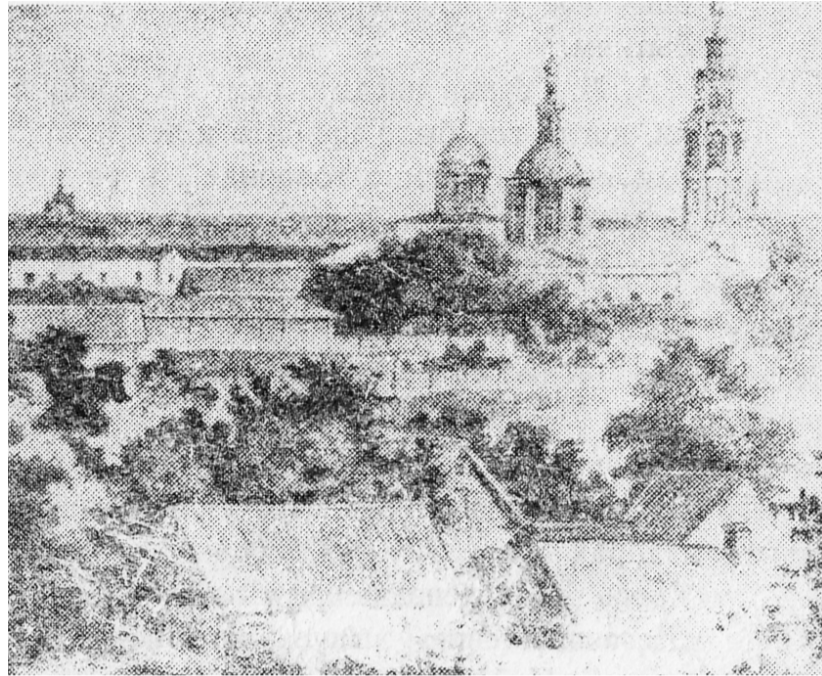
Вид г. Орла. Гравюра начала XIX века

В эти годы в Орле жил известный русский писатель Николай Семенович Лесков (1831–1895), уроженец села Горохова Орловской губернии. Дом на Октябрьской ули-