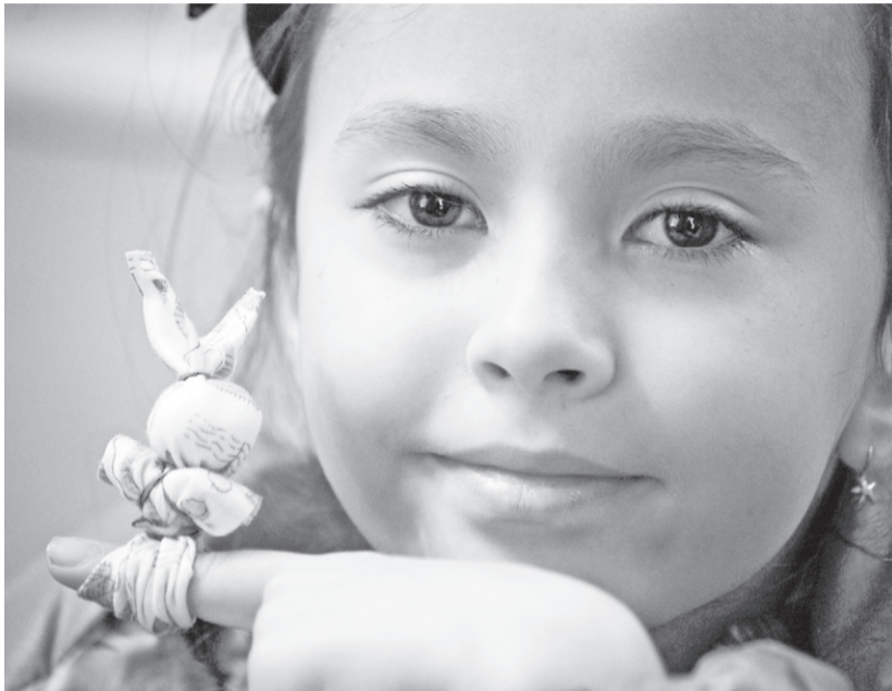
Вот такой он — оберег для малышей

В ДОМЕ-МУЗЕЕ ГРАНОВСКОГО ОТКРЫЛСЯ ЦИКЛ МАСТЕР-КЛАССОВ ДЛЯ ШКОЛЬНИКОВ «ВОЗРОЖДАЕМ ТРАДИЦИИ»