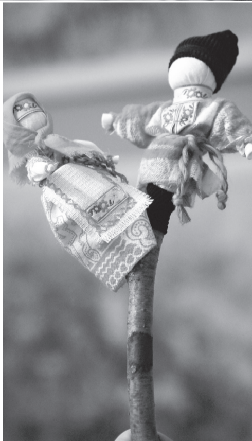
А мировое дерево — это кукольная пара