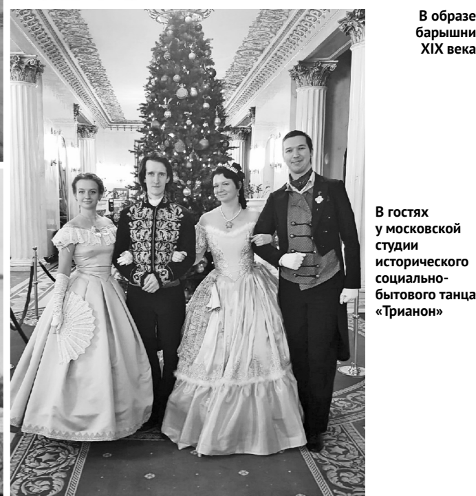
В гостях у московской студии исторического социально-бытового танца «Трианон»

ете, у вас уже есть багаж знаний, которым можно было бы делиться, авторитет.