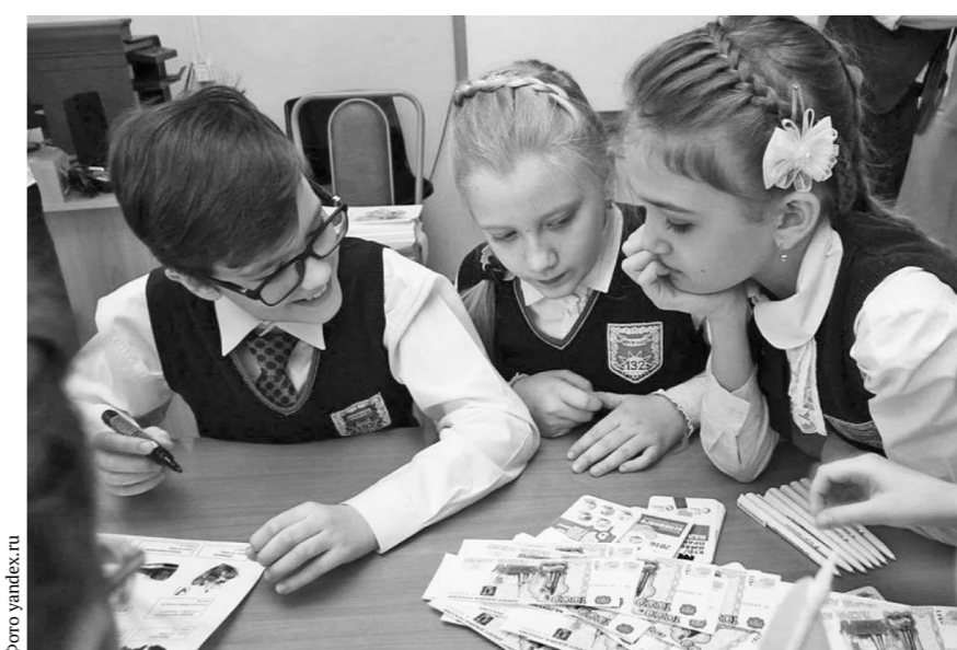
Деньги счёт любят

На занятиях, в частности, можно будет узнать о вкладах, кредитах, различных