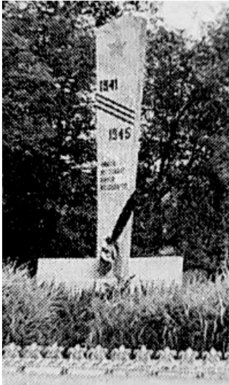
Стела на могиле «крылатого поэта»

Вышедший фронтовик поведал, что в день начала операции «Ливенский щит», 28 июня 1942 года, он находился из-за