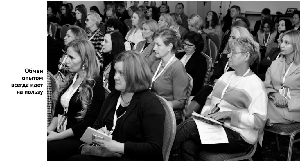
Обмен опытом всегда идёт на пользу

Государственный мемориальный и природный музей-заповедник А. Н. Островского «Шелыково», Государственный музей — заповедник М. А. Шолохова и многие другие. Конечно же, в этом списке и Государственный мемориальный и природный музей-заповедник И. С. Тургенева «Спасское-Лутовиново».