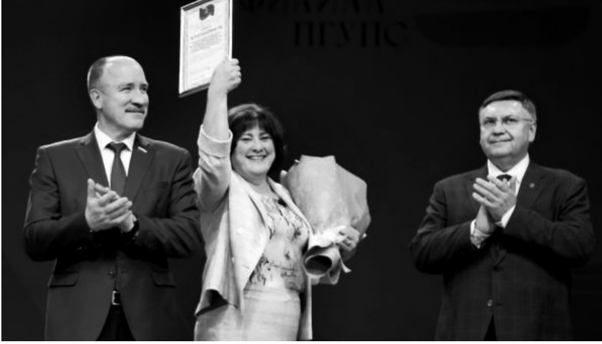
Юбилеры принимают поздравления

— За минувшие сто лет из его стен вышли 25 тысяч выпускников, которые стали специалистами высочайшего класса. Хочу поблагодарить преподавателей и ветеранов за то, что в Орловской области куётся кадровый потенциал не только нашего региона, но и страны! Искренне поздрав-