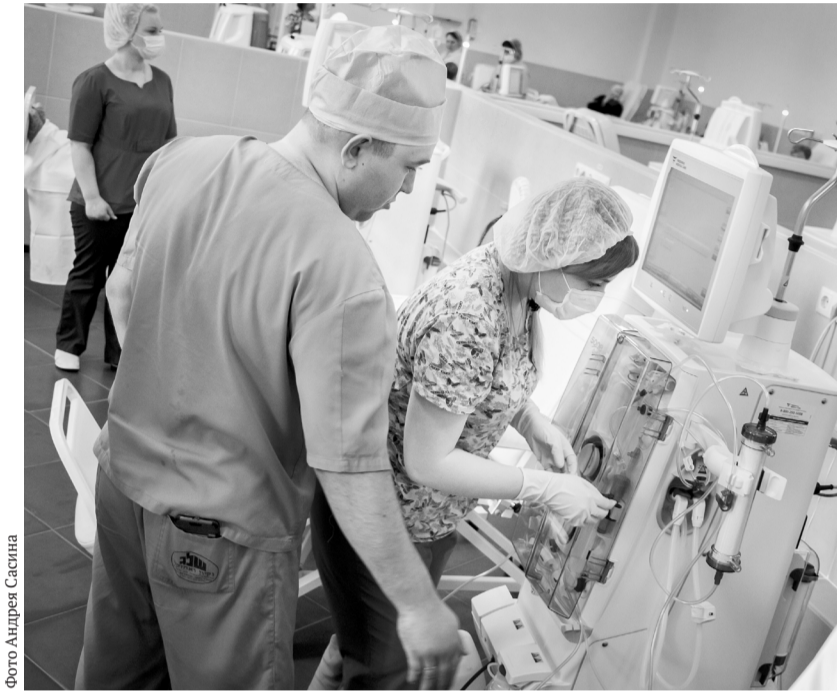
Врачи отделения довольны умным аппаратом

Мы подошли к одному из новых аппаратов. На мониторе компьютера высвечивались все необходимые параметры: время проведения процедуры, скорость кровотока, давление кро-