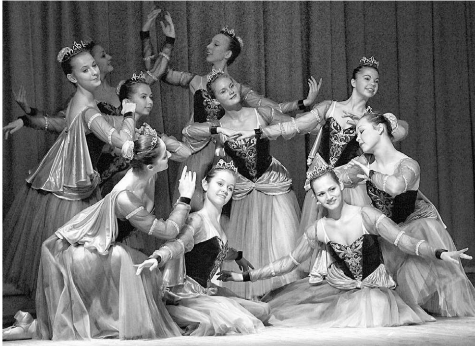
Танец «Венецианское адажио» признан лучшим на конкурсе

Нужно отметить, что российская школа танца