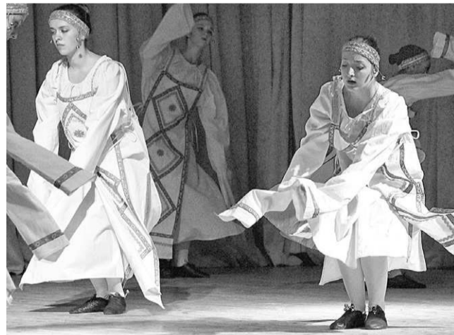
Всех покорила танец «Звон. Русь изначальная»

вдруг озорно подмигнула всем, взмахнула рукой: «Эх была, не была!», — и пустилась в пляс. Каблучки выделявали