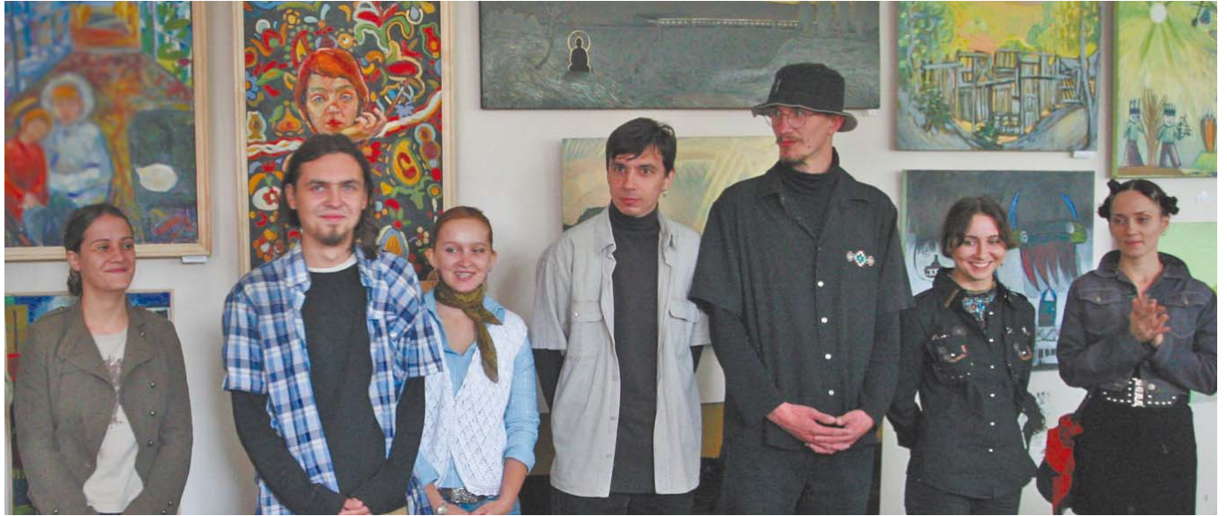
Выпускники Орловского художественного училища — участники выставки.

В актовом зале Орловского художественного училища открылась выставка работ недавних выпускников ОХУ. Молодые художники сейчас продолжают учёбу в других учебных заведениях, в том числе таких известных и престижных, как Московская художественная промышленная академия им. Строганова и Московский государственный академический художественный институт им. Сурикова (МГАХИ). Восемь человек объединили свои усилия, чтобы показать друг другу и зрителям, что они наработали за последнее время, как выросло их мастерство, в каком направлении развивается их творчество.