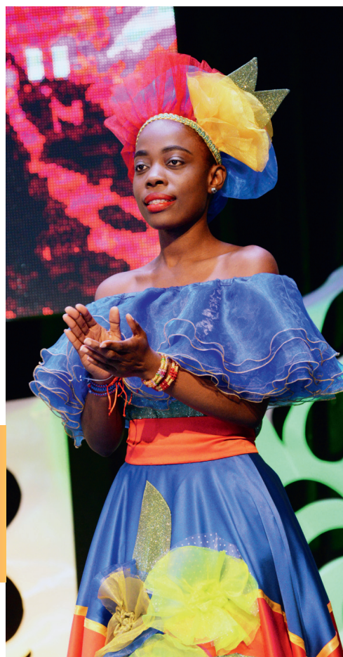
Оборудование: Николай Шмидт

Красивые, яркие, креативные — такими запомнились зрителям и жюри участники шоу-конкурса