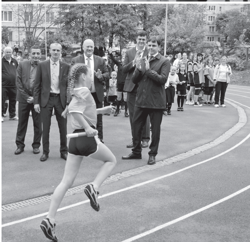
Юные спортсмены отметили открытие ФОКот первыми соревнованиями