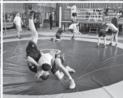
В школе олимпийского резерва созданы условия для занятия разными видами спорта

ра и внимательно прислушиваются к их пожеланиям. Радует их и то, что подрядчик обещает завершить работы раньше обозначенного срока — уже в середине июня.