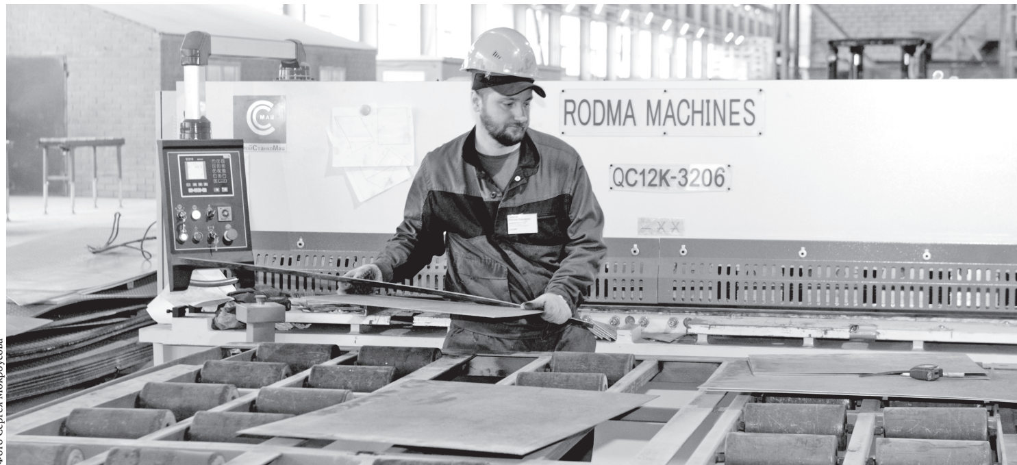
Новое производство в Мценске набирает обороты

Жильцы рассказали губернатору, что довольны работой строителей, которые находятся на объекте с семи утра до семи вече-