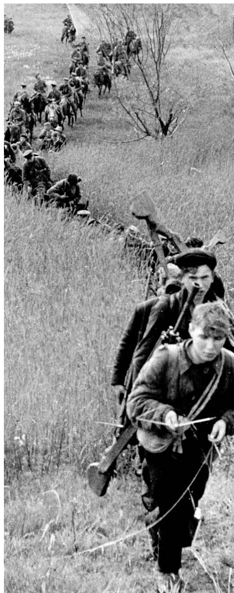
«Орловская правда» от 19 сентября 1943 года

На оккупированной территории Орловской области партизаны изгнали врага более чем из 500 населенных пунктов. Там были восстановлены органы советской власти, действовали аэродромы, работали мастерские, издавались газеты