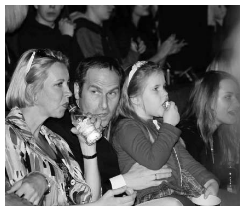
Татьяна, Михаил и их дочери Тося и Соня

Телезвезда, как оказалось, находит время не только на своих детей, но и на чужих. Татьяна Лазарева уже около десяти