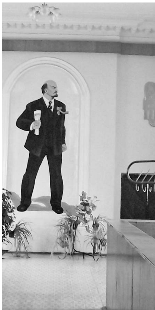
И Ленин такой молодой встречает посетителей на входе в Свердловскую администрацию

В суд не пришли руководители из налоговой, из финансового отдела, из нового отдела образования. Даже из директора школ защищать коллегу — и то по повестке — согласились директора Змиевского лицея и Яковлевской школы.