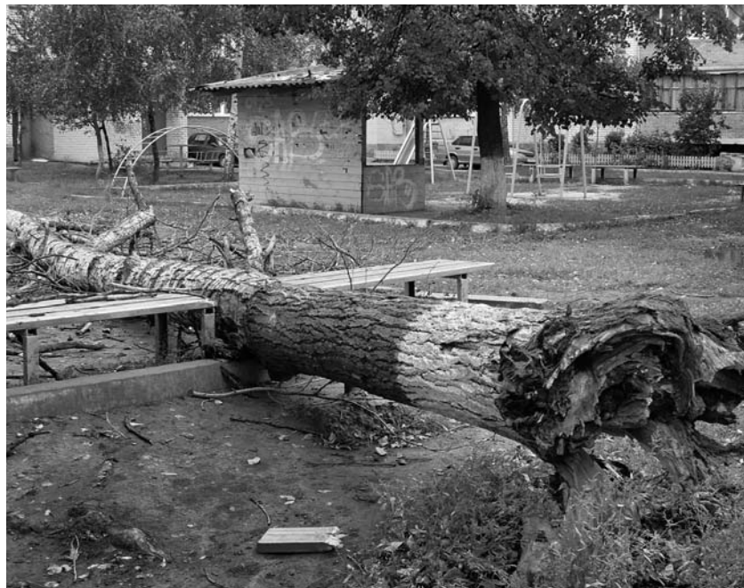
Тополь, заболтливо побеленный весной, осенью упал точно между двумя скамейками во дворе дома № 49 кроной к детской площадке