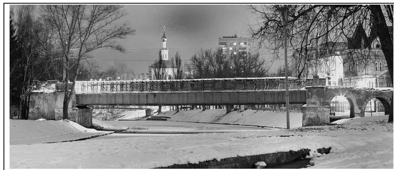
СТАРИННЫЙ И ВЕЧНО ЮНЫЙ ОРЕЛ.