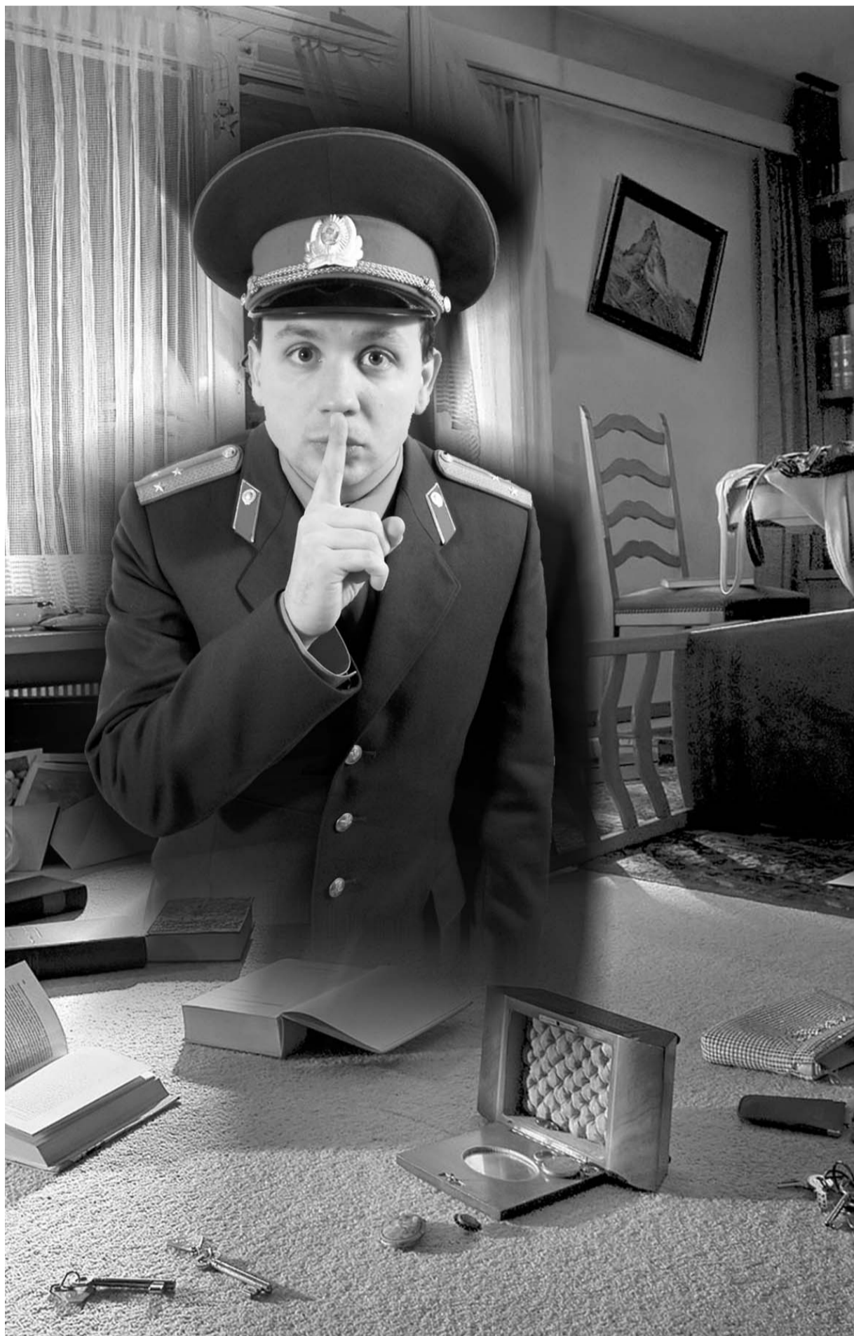
Есть как минимум 50 уловок, чтобы не довести дело до суда