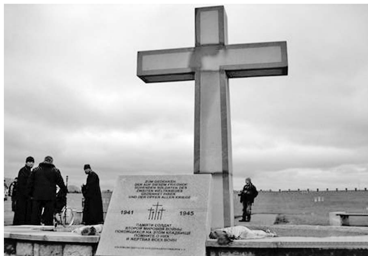
Немецкое солдатское захоронение в с. Беседино Курской области

Немцы окропили шнапсом траву возле Знаменского районной больницы — где-то тут и был немецкий лазарет — и выпили по стопке в память о деде. Выпили по-русски — «тринкен драй», что значит «на троих»: сын, которому за шестьдесят, и два внука — старше тридцати. Внучка бросила цветы на газон. Больше некуда.