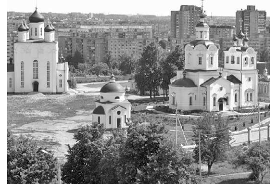
Комплекс Успенского монастыря в Орле, по сути, заново отстроен

До конца ноября орловцы могут поддержать местные достопримечательности в конкурсе «Чудо России-2012».