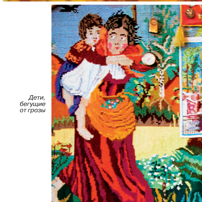
Дети, бегущие от грозы