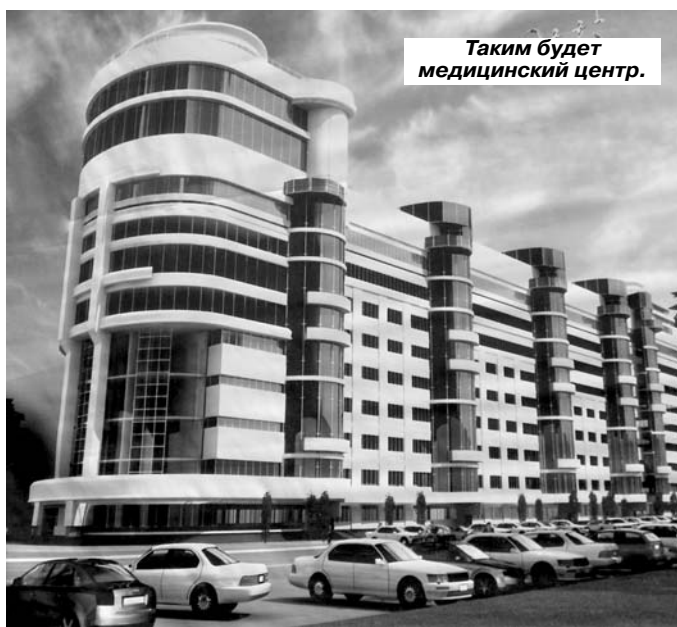
Таким будет медицинский центр.