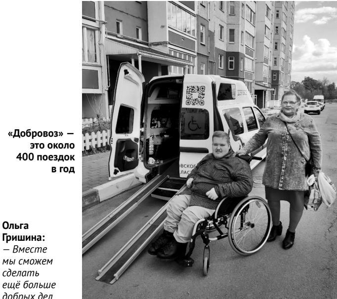
«Добровоз» — это около 400 поездок в год

— Комплектация автомобиля полностью подходит для перевозки маломобильных граждан. При выборе машины мы уделяли вни-