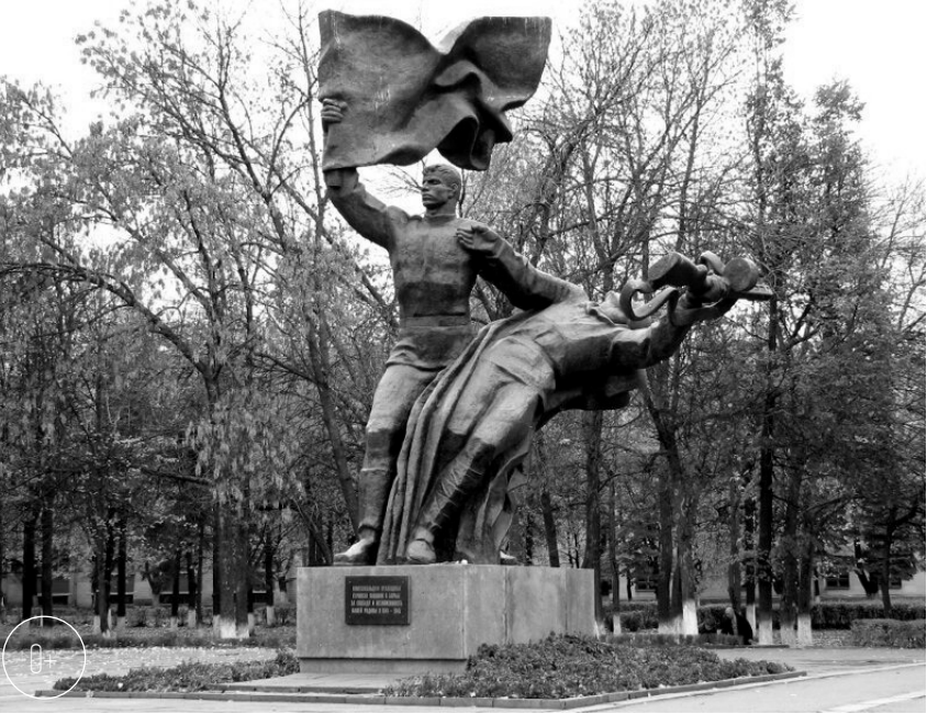
Памятник в честь 400-летия основания Орла