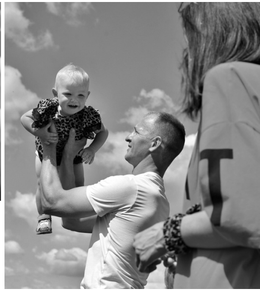
Будущее района — в надёжных руках