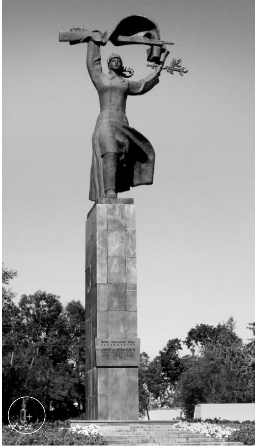
Памятник героям Гражданской войны

Зрители увидят два десятка скульптурных работ малых форм и фотографии его огромных монументов в разных концах нашей Родины и за рубежом, а также удивительные листы графики, наполненные философскими рассуждениями о добре и зле, жизни и смерти. И всё это только малая толи-