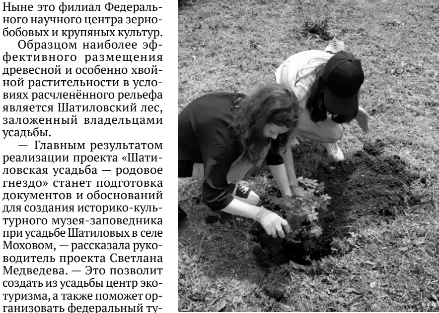
Энтузиасты и волонтеры активно занимаются восстановлением и благоустройством Шатиловской усадьбы

В этом году для участия в шести номинациях премии — «Культура», «Церковь», «Пространство», «Память», «Среда», «Русская традиция» — было подано 513 заявок из 320 городов и 77 регионов России, отобрано — 110. Среди отобранных на награждение в номинации «Пространство», которая собрала проекты, направленные на сохранение архитектурного и культурного наследия, восстановление старинных усадеб, обустройство новых городских пространств, благоустройство городов и сёл, есть и орловский — «Шатиловская усадьба — родовое гнездо».