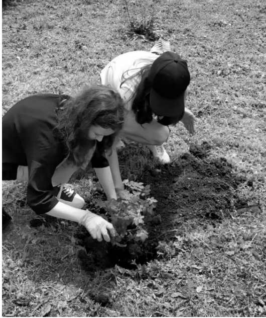
Энтузиасты и волонтеры активно занимаются восстановлением и благоустройством Шатиловской усадьбы