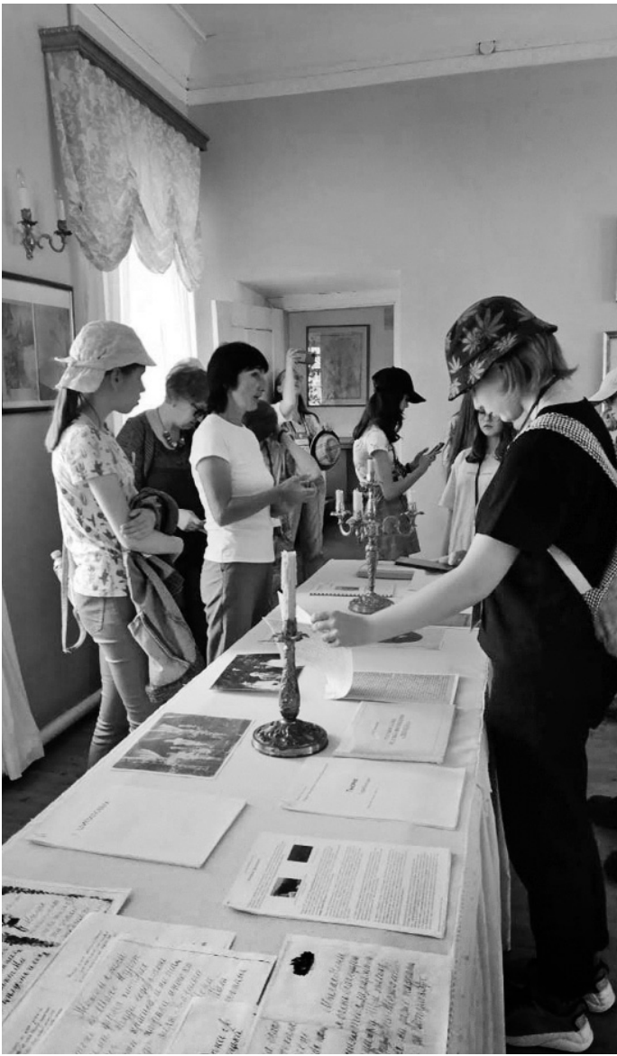
Энтузиасты и волонтеры активно занимаются восстановлением и благоустройством Шатиловской усадьбы