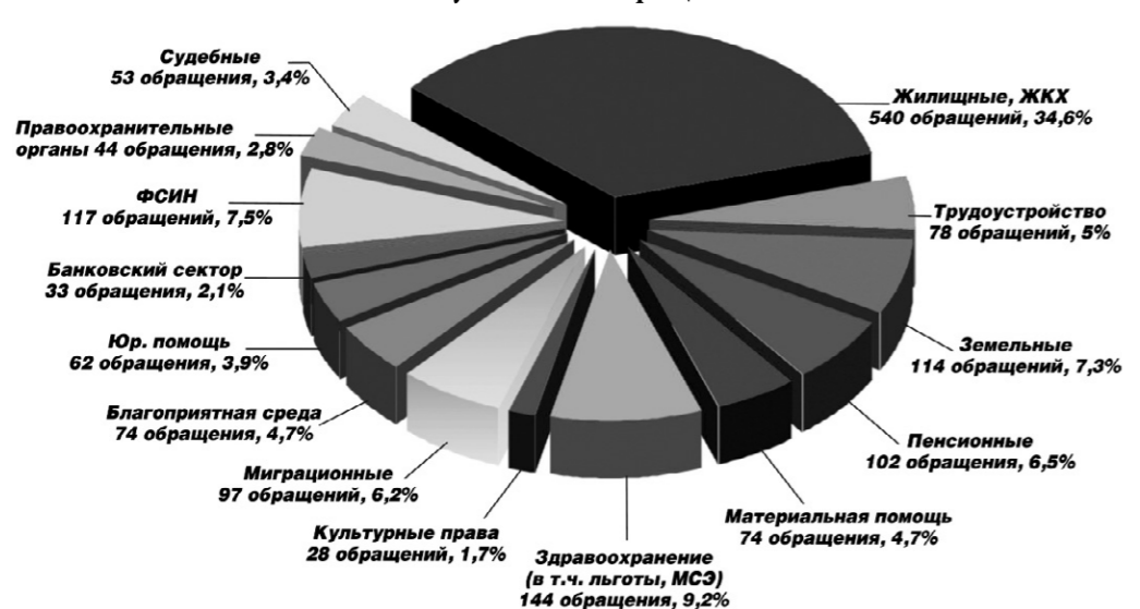
В 2016 году к Уполномоченному по правам человека в Орловской области поступило 1560 обращений

С полным текстом документа можно ознакомиться в государственной специализированной информационной системе «Портал Орловской области — публичный информационный центр» и на официальном сайте Уполномоченного по правам человека в Орловской области в сети Интернет.