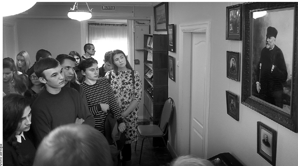
Экскурсия в мир Лескова

Первый лесковский спектакль в театре был поставлен в 1956 году по «Тупейному художнику» и назывался «Крепостные актёры». В 1970-х годах были поставлены спектакли, в основе которых