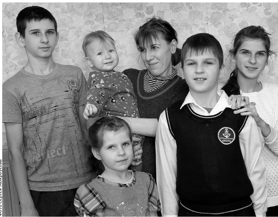
Они не верили, что война надолго...

У этой многодетной семьи из Донецкой области были свои дом, работа, друзья, а сейчас не хватает денег даже на самое необходимое. Они бежали из родной Константиновки в июле 2014 года, когда по её улицам уже колесили бэтээры и ходили военные с автоматами.