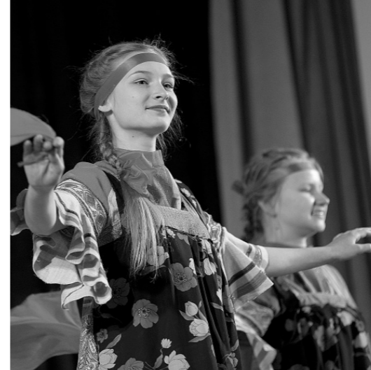
Номинация «Русский народный танец» оказалась самой многочисленной

— В последнее время всё чаще юные исполнители на сцене вместо обычного номера показывают настоящие танцевальные спектакли — с декорациями, необычными костюмами, интересными фонограммами, — говорит Сергей Петрович. — Это