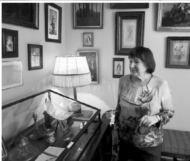
Петербургский кабинет Н. С. Лескова