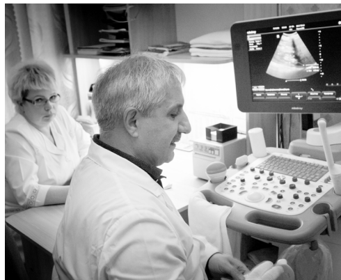
В Новодеревеньковской ЦРБ есть самое современное оборудование

ровой кабинеты, кабинеты окулиста, отоларинголога, нарколога. В детской поликлинике приём ведут два врача-педиатра, есть прививочный кабинет и кабинет здорового ребёнка, а также физиотерапевтический кабинет, кабинет УЗИ, лаборатория, кабинет функциональной диагностики, приёмное отделение, отделение скорой медицинской помощи, в отдельном здании — пищеблок.