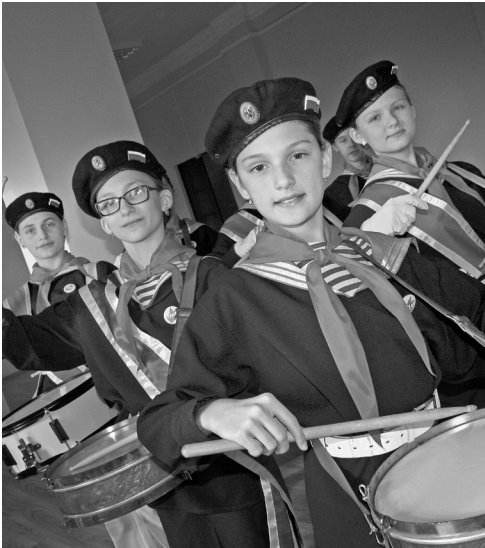
Команда г. Мценска привыкла побеждать