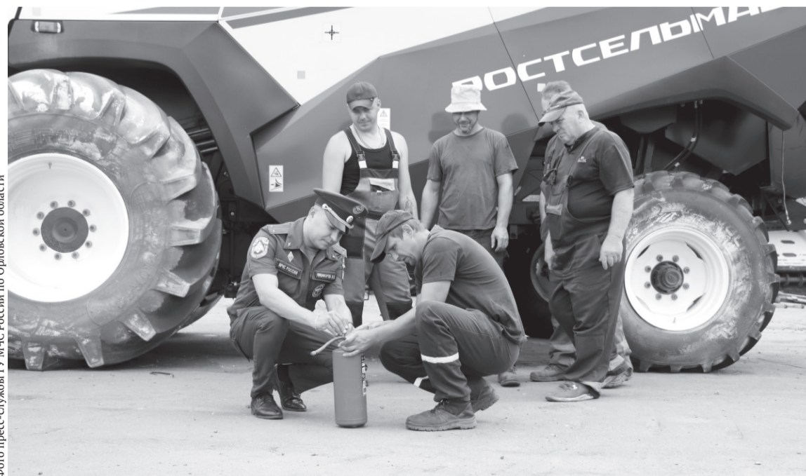
Комбайнёрам напомнили, как пользоваться огнетушителями