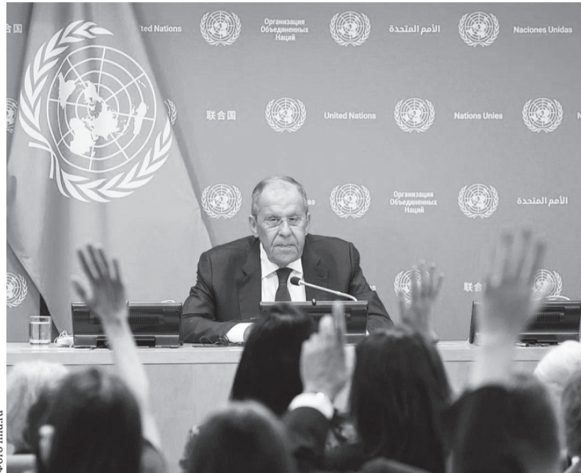
Сергей Лавров: — После начала специальной военной операции, после того, как мы объяснили исчерпывающим образом, что у нас не остаётся другого выбора, как защитить интересы безопасности, людей, которых киевский режим объявил террористами и бомбит ежедневно, никаких контактов с Соединёнными Штатами не было

Если говорить о мирных стараниях, почему-то все говорят про Бюргеншток — никто не говорит про инициативы КНР, которых было несколько. В феврале 2023 года и позднее Китай выдвигал свои предложения. Недавно Китай вместе с Бразилией оформили несколько элементов инициативы. Главное отличие от «формулы Зеленского» и от того, что делается на этих «сходках» в рамках «копенгагенского формата», в том, что, во-первых, Китай, Бразилия и многие другие страны, которые к ним присоединились, выступают за то, чтобы созвать конференцию