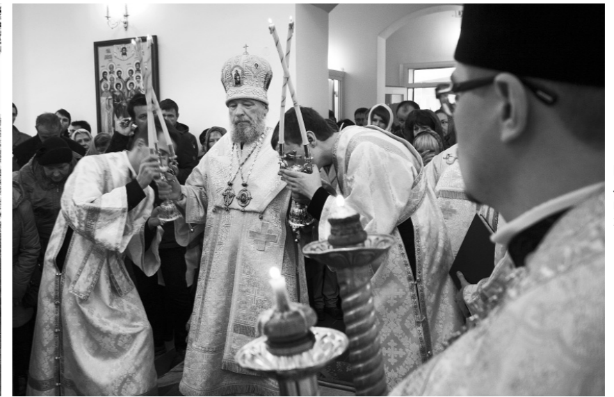
Божественная литургия в новом храме

Храм на территории областной больницы в Орле заложил в ноябре 2009 года. Строился он на пожертвования организаций, предприятий и отдельных верующих. В 2013 году красивое здание в византийском стиле увенчал