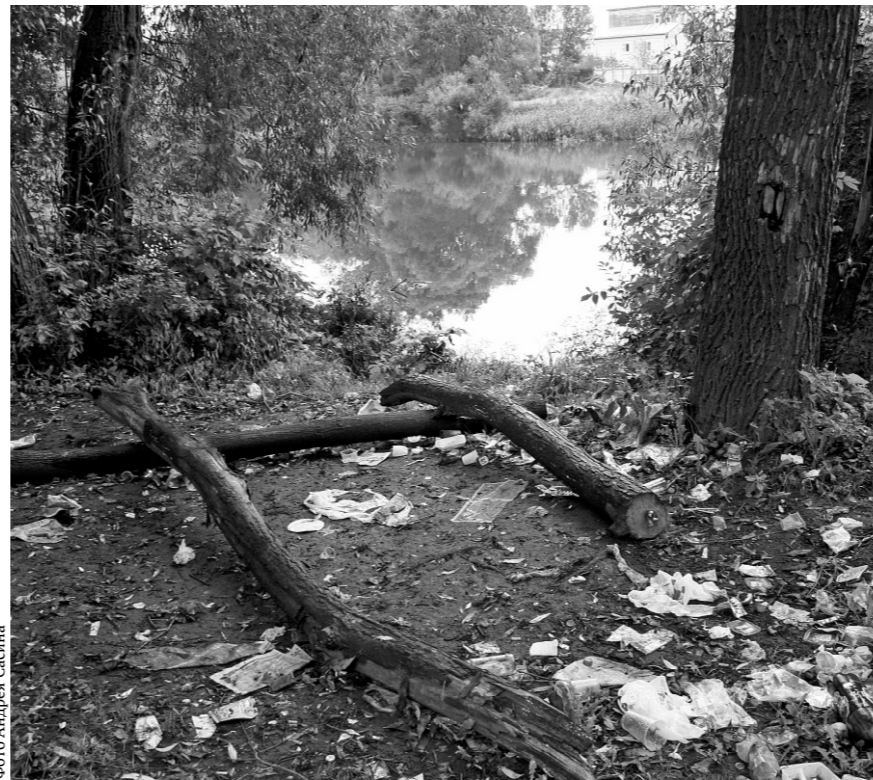
Берега рек утопают в мусоре

За последние два года на территории Орловской области было построено три новых сортировочных комплекса, сейчас в стадии запуска новый полигон в г. Мценске, где предварительно будет осуществляться обработка отходов и после этого производиться захоронение с соблюдением санитарных и экологических стандартов, — рассказал зам-