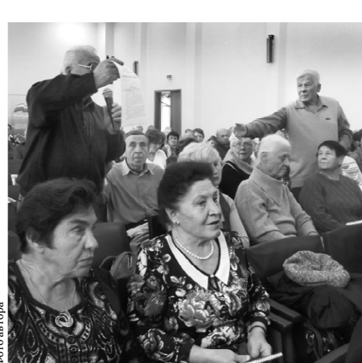
Слушатели школы жилищного просвещения получили ответы на острые вопросы

— Ежегодно мы проводим в областном центре конкурс на лучшие улицы, двор, дом, подъезд, — напомнил он. — Отлично, что в Орле немало домов, которые содержатся в образцовом порядке, и дворовых площадок в идеальном состоянии. Такое можно увидеть там, где жильцы радуют за своё имущество, знают, как им грамотно распоряжаться, вплоть до того, что менять лифтовое оборудование за свои накопленные деньги. Администрация города готова и дальше помогать школе жилищного просвещения, не только предоставляя помещения для занятий, но и органи-