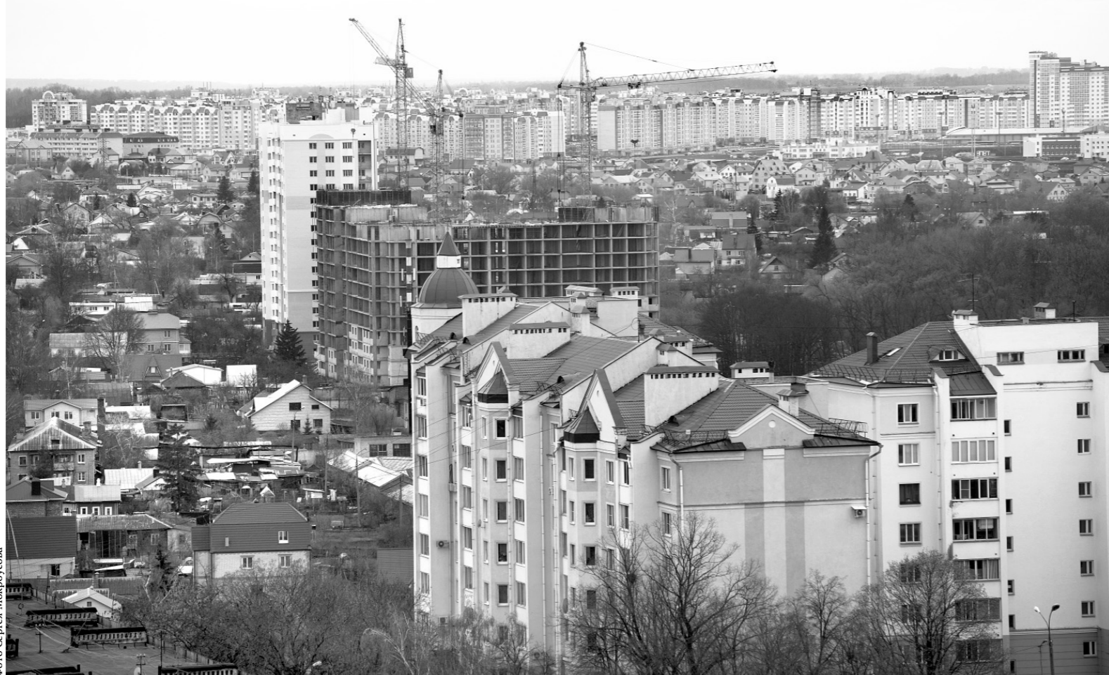
Президентом страны поставлена задача — к 2020 году выйти на уровень ввода жилья, равный 1 кв. м на одного жителя в год

О том, что волнует наш регион, участники заседания услышали, когда слово было предоставлено губернатору