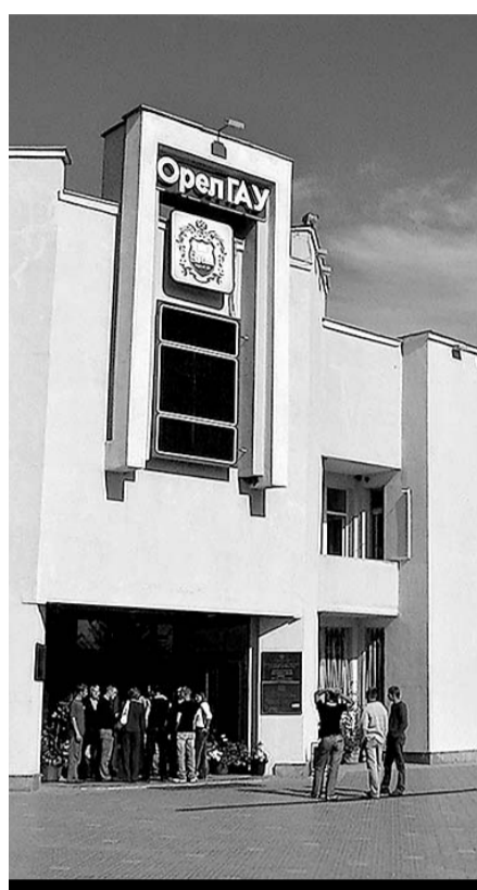
ВСТУПИТЕЛЬНЫЕ ЭКЗАМЕНЫ В ВУЗАХ

В период с августа по октябрь для центральной районной больницы поступит медицинская техника на общую сумму восемь миллионов рублей. Это — рентгенологическое и лабораторное оборудование, приборы ультразвукового исследования, оборудование функциональной диагностики, а также два автомобиля "Скорой помощи".