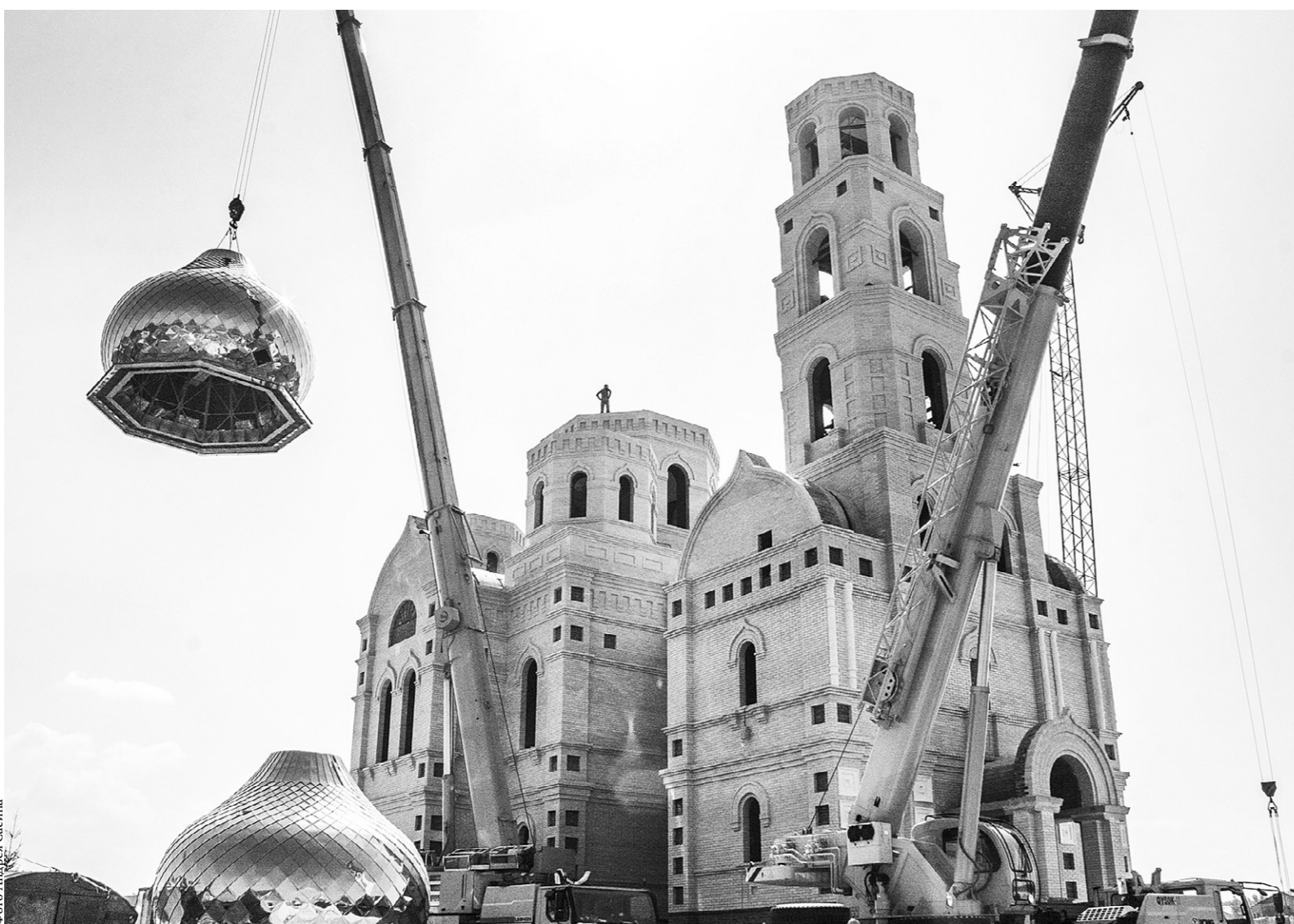
Радая сердца прихожан, вознесутся над храмом золотые купола