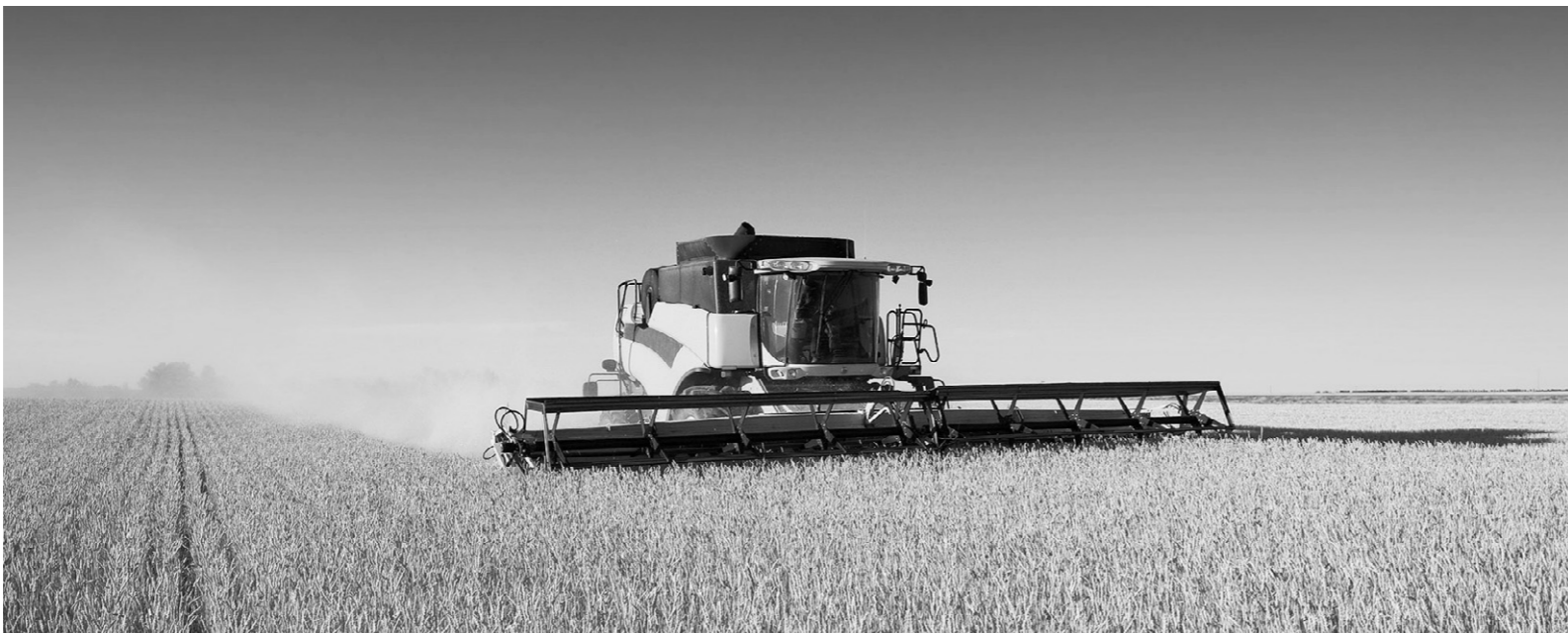
Комбайн в поле — хлеб в закромах

— На данный момент эти цифры превышают прошлогодние показатели, — говорит замначальника областного управления сельского хозяйства по развитию технологий в растениевод-