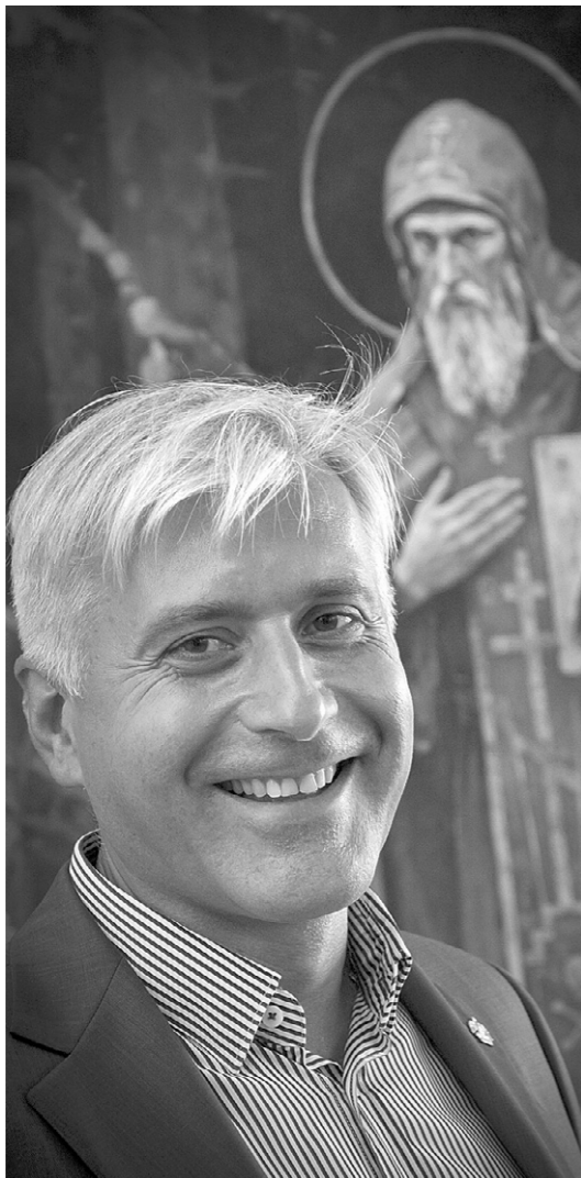
Картины Василия Нестеренко можно назвать осиянными духовным светом

В областном выставочном центре открылась выставка народного художника России, академика Российской академии художеств Василия Нестеренко