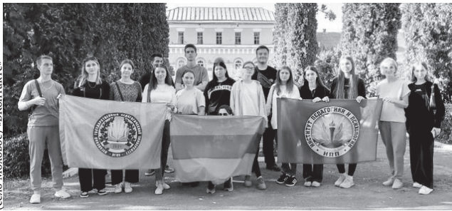
Фото музея-усадьбы Шатиловых (село Моховое) «ВКонтакте»

Речь шла о перспективах и стратегических планах