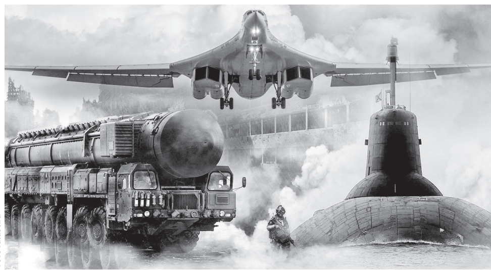
Ядерная триада России — в полной боевой готовности

Не прислушались на Западе и к короткой, но крайне поучительной дискуссии, случившейся 7 июня этого года на сессии Петербургского международного экономического форума. После выступления Владимира Путина к нему обратился модератор сессии — научный руководитель факультета мировой экономики и мировой политики НИУ Высшей школы экономики Сергей Караганов. Он сказал российскому лидеру, что, дескать, нужно гораздо