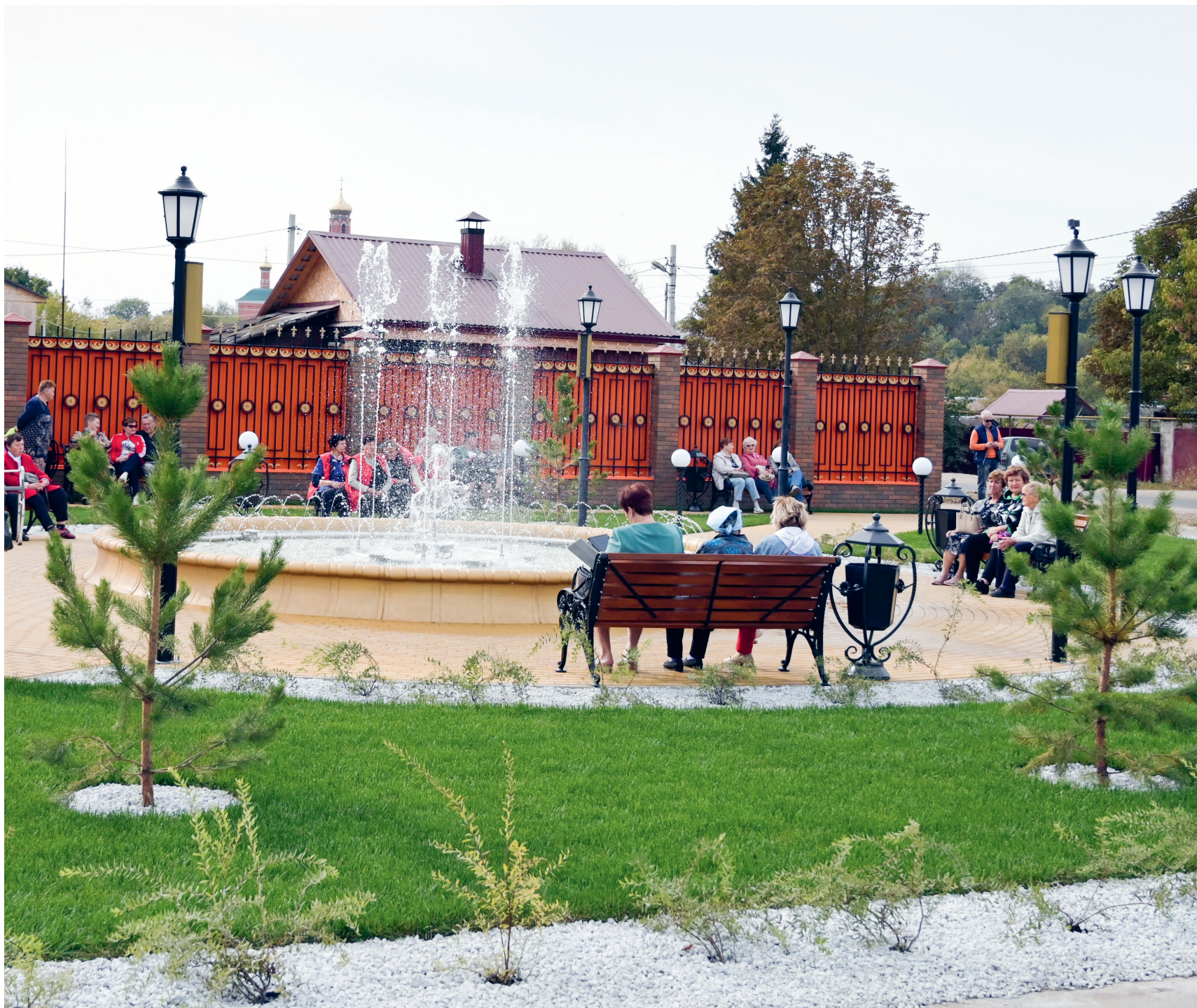
Сквер с цвето-музыкальным фонтаном у Болховского завода полупроводниковых приборов — излюбленное место отдыха болховчан

намотки стартера шаговых двигателей серии «Немо». Потенциал рынка огромный — вся современная техника и электроника основаны на шаговых двигателях. Болховские инженеры-электронщики уже подготовили к выпуску линейку из шести двигателей с разными габаритами. Еще одно направление перспективных инноваций БЗПП — разработка микросхем интерфейса, который используется в любых направлениях — компьютерах, смартфонах, промышленном оборудовании, авиации. Уже создали более 200 номиналов новых изделий — микросхем.