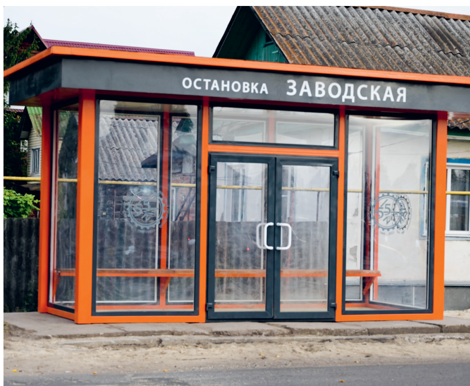
Такая надёжно защищающая от непогоды современная остановка — мечта пассажиров

Технические возможности оборудования позволили в обустройстве новой территории применить своё мастерство, что уже, кстати, вошло в традицию.