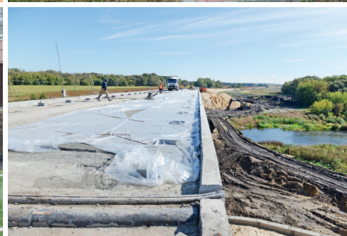
Ремонт моста — в графике