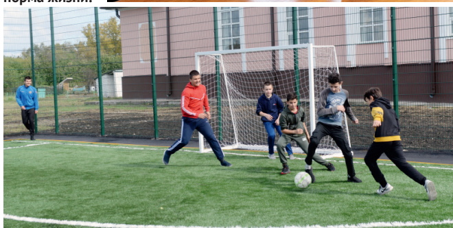
Спорт — норма жизни!

и землякам в решении социальных вопросов.