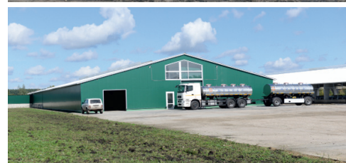
За молоком в Сосновку приходит мощный молоковоз

здание школы — ему необходим капитальный ремонт. Отмечалось, что он возможен в 2025 году по президентской программе капитального ремонта школ при наличии проектно-сметной документации. Депутат