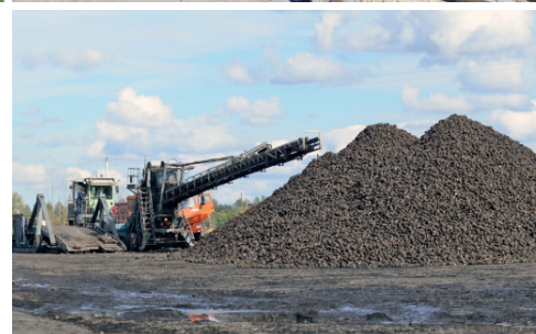
На Ливенском сахарозаводе успешно стартовал «сладкий» сезон