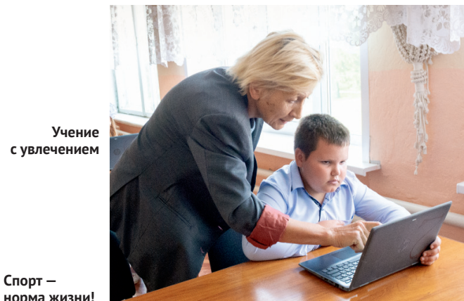
Учение с увлечением