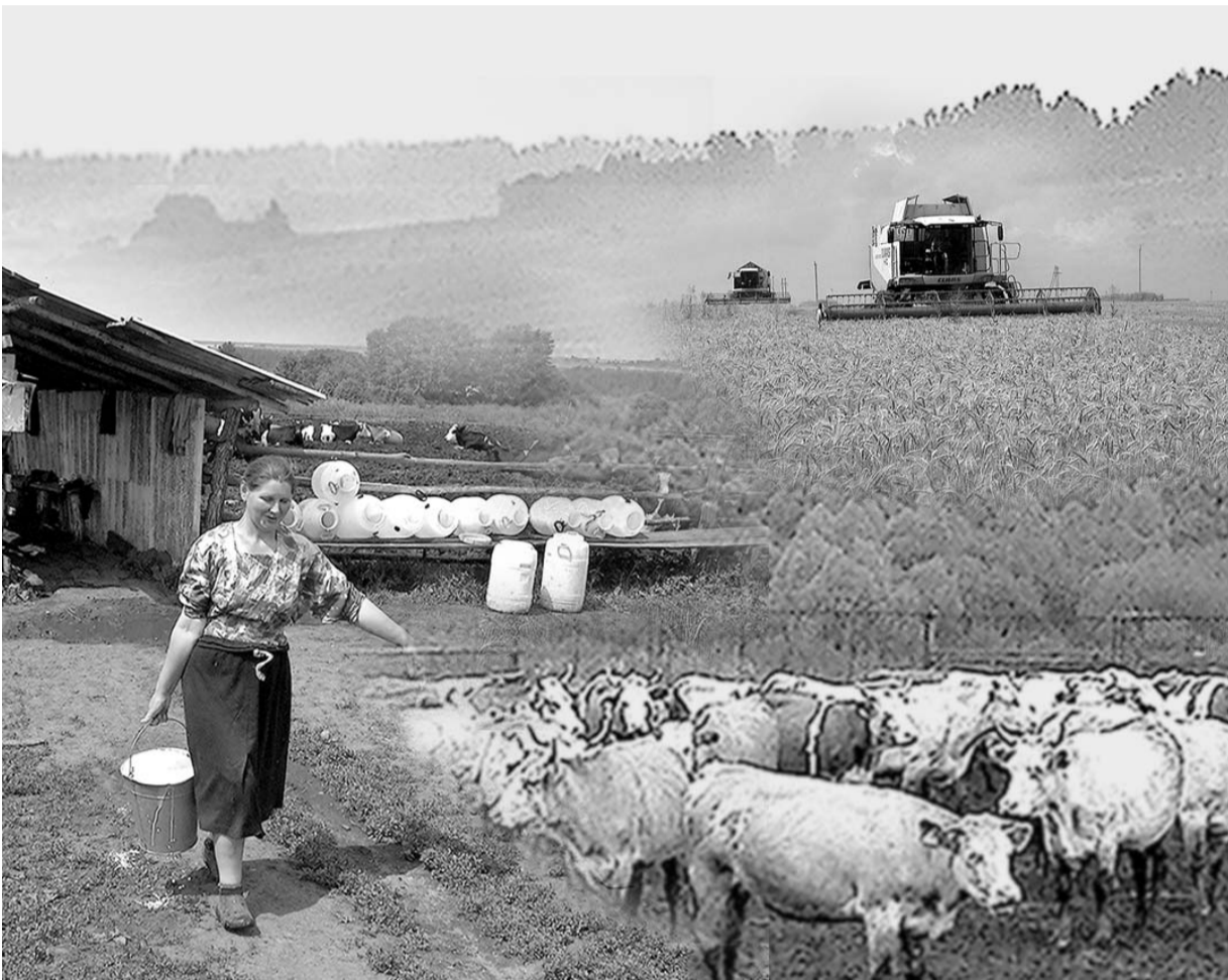
Уважаемые работники сельского хозяйства и перерабатывающей промышленности!

Сердечно поздравляю вас с профессиональным праздником!