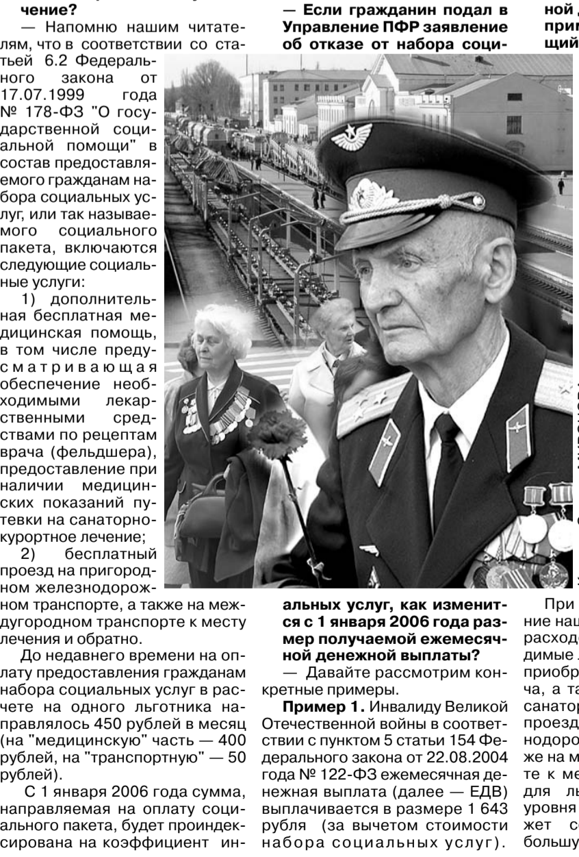
Коллаж Сергея МИРОНОВА.

С 1 января 2006 года сумма, направляемая на оплату социального пакета, будет проиндексирована на коэффициент ин-