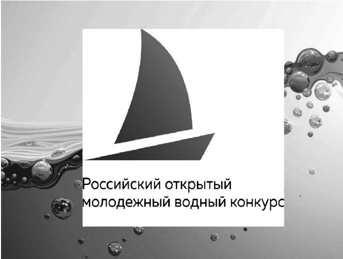
Российский открытый молодежный водный конкурс

На базе Орловской станции юных натуралистов 15 февраля прошёл ежегодный региональный этап Российского открытого молодёжного водного конкурса.