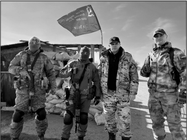
На линии фронта