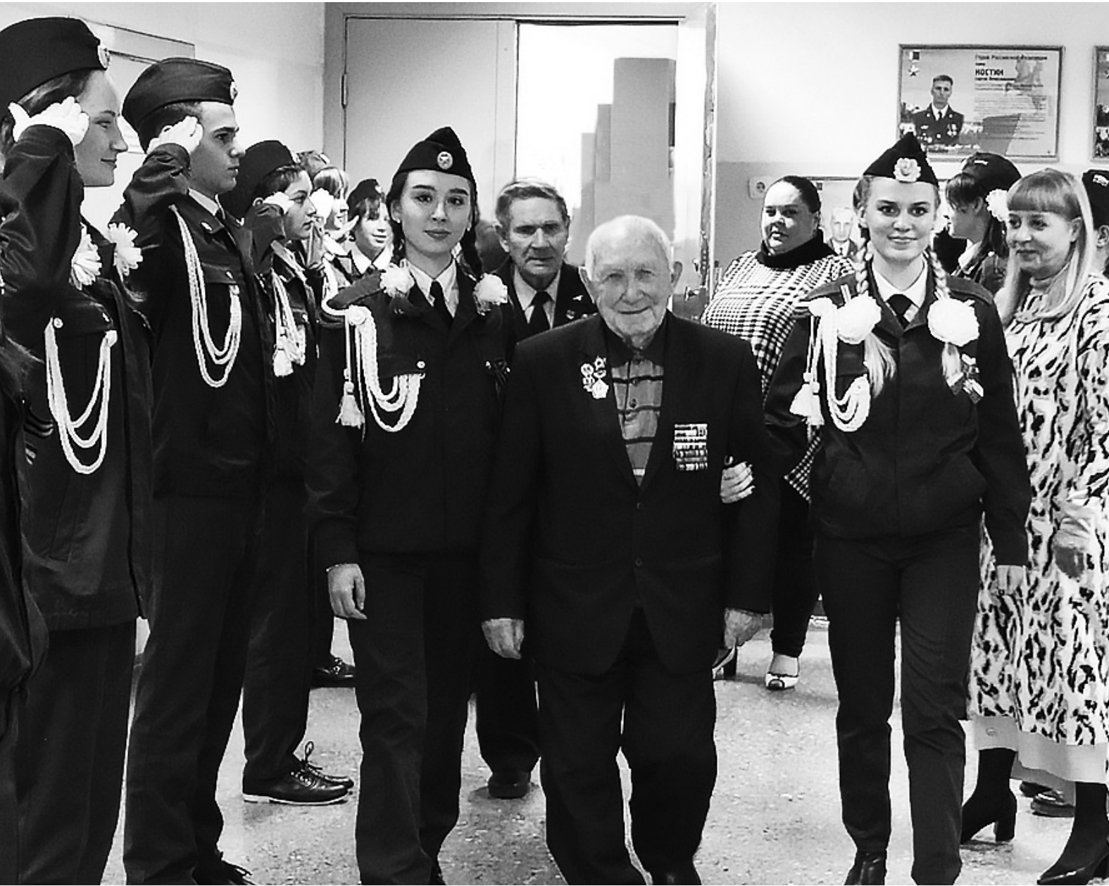
У героев растёт достойная смена

— У меня воевал прадед, он выжил — умер 15 лет назад. А прапрадед погиб в Ржевской битве. Прабабушка была унгула из Белоруссии в плен, но наши бойцы её и других пленных освободили. Вернулись они в полностью разрушенную, сожжённую дотла деревню. Её пришлось отстраивать заново. Мой двоюродный дядя участвует