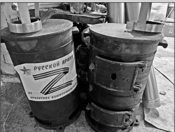
Сделано на Орловщине