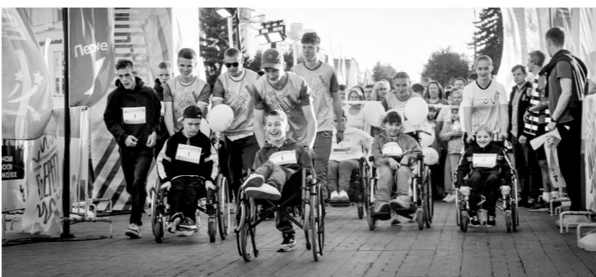
Вместе от старта — к финишу

Лица Осипова, участница инклюзивного забега: — О марафоне «Поберегу» я узнала от своей мамы, которая увидела объявление о нём в соцсетях. Основная цель сегодняшнего забега — не спортивные достижения, не привлечение внимания к своей персоне, а внесение личного вклада в благотворительность, целью которой будет создание ещё одной инклюзивной спортплощадки для детей с ограниченными возможностями здоровья. Все дети должны иметь равные возможности для занятия спортом.