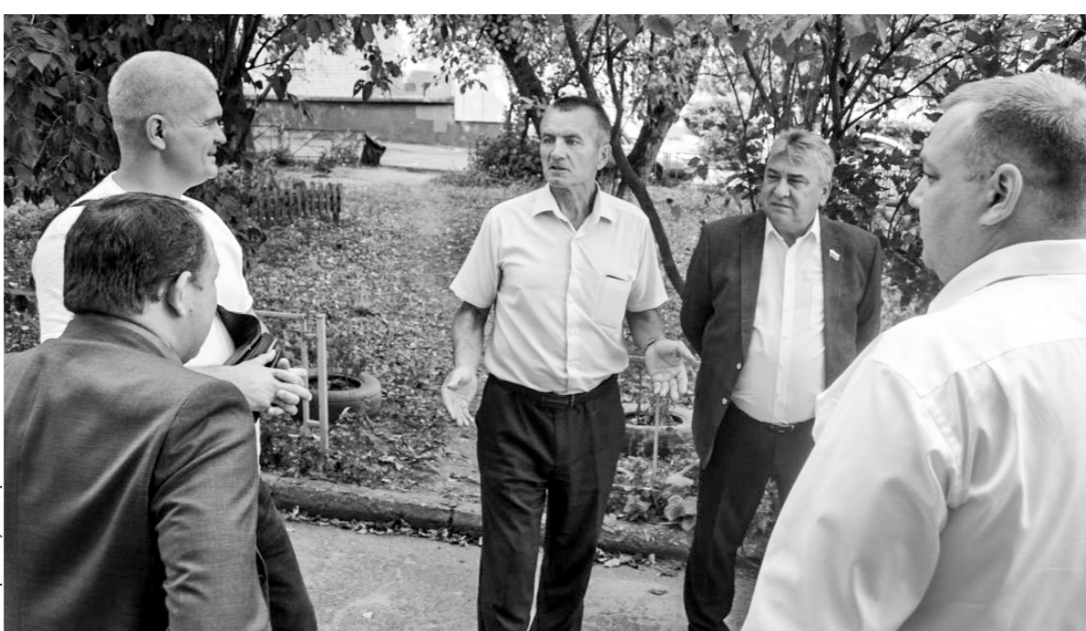
Мнение депутатов было единодушным — до наступления дождей дома № 3 на улице Гостиная в Орле должна появиться надёжная крыша

Мы увидели, что работы на объекте нет, подрядчик встретил нас крайне раздражённо, жители негодуют, —