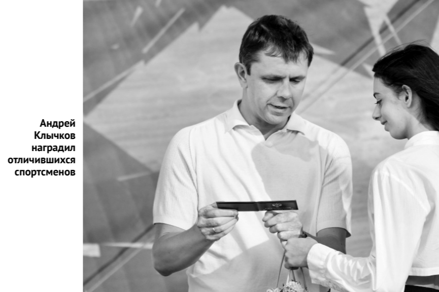
Андрей Клычков награждает отличившихся спортсменов

Приветствуя участников марафона, губернатор Андрей Клычков отметил, что на благотворительную акцию собрались люди, не равнодушные к спорту и происходящему вокруг.