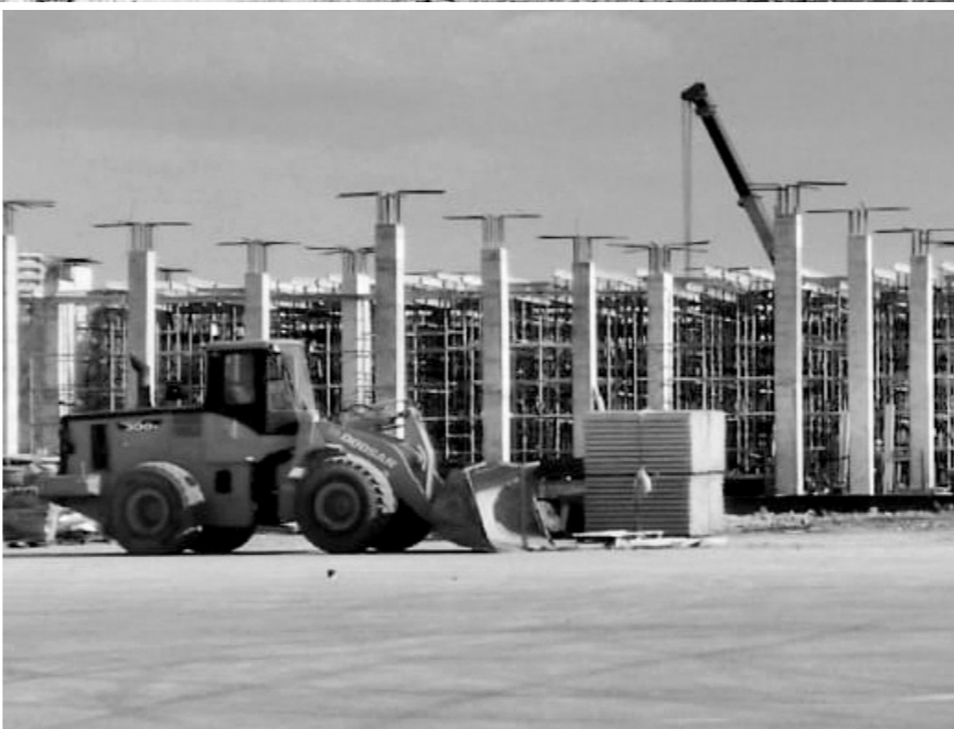
Завершено устройство монолитных колонн здания аэропорта

Длина взлётно-посадочной полосы составит 2,4 км , ширина — 45 м