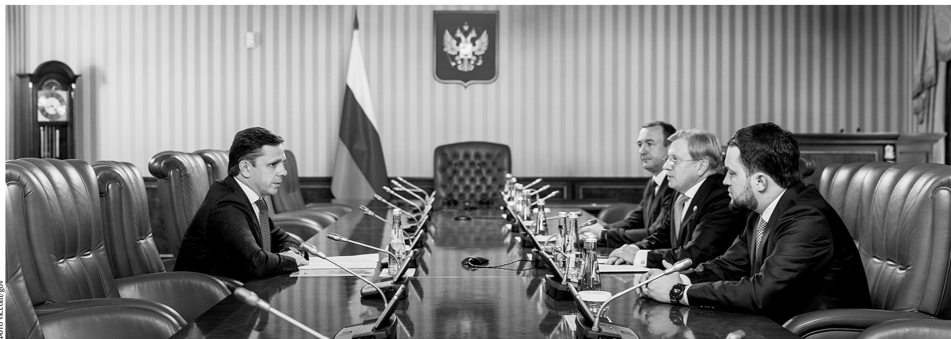
Встреча губернатора Орловской области Андрея Клычкова с заместителем Председателя Правительства РФ Виталием Савельевым

Вице-премьер РФ Виталий Савельев поддержал реализацию второго этапа реконструкции аэропорта Орёл-Южный