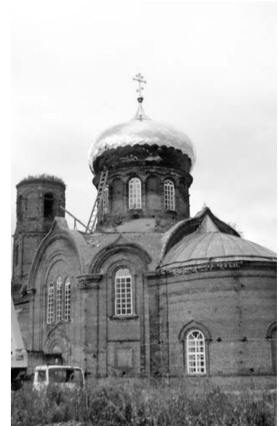
Теперь осталось завершить колокольню