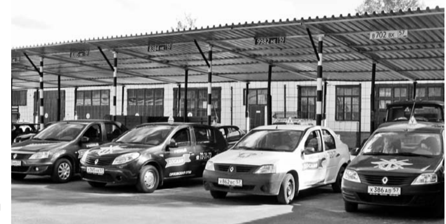
Хорошая машина — залог успешного обучения вождению

Начнем с того, что Орловский учебный центр ДОСААФ — старейшее заведение в Орле, которое занимается подготовкой водителей. Соответственно опыт обучения накоплен немалый. У них разработаны программы, которые не