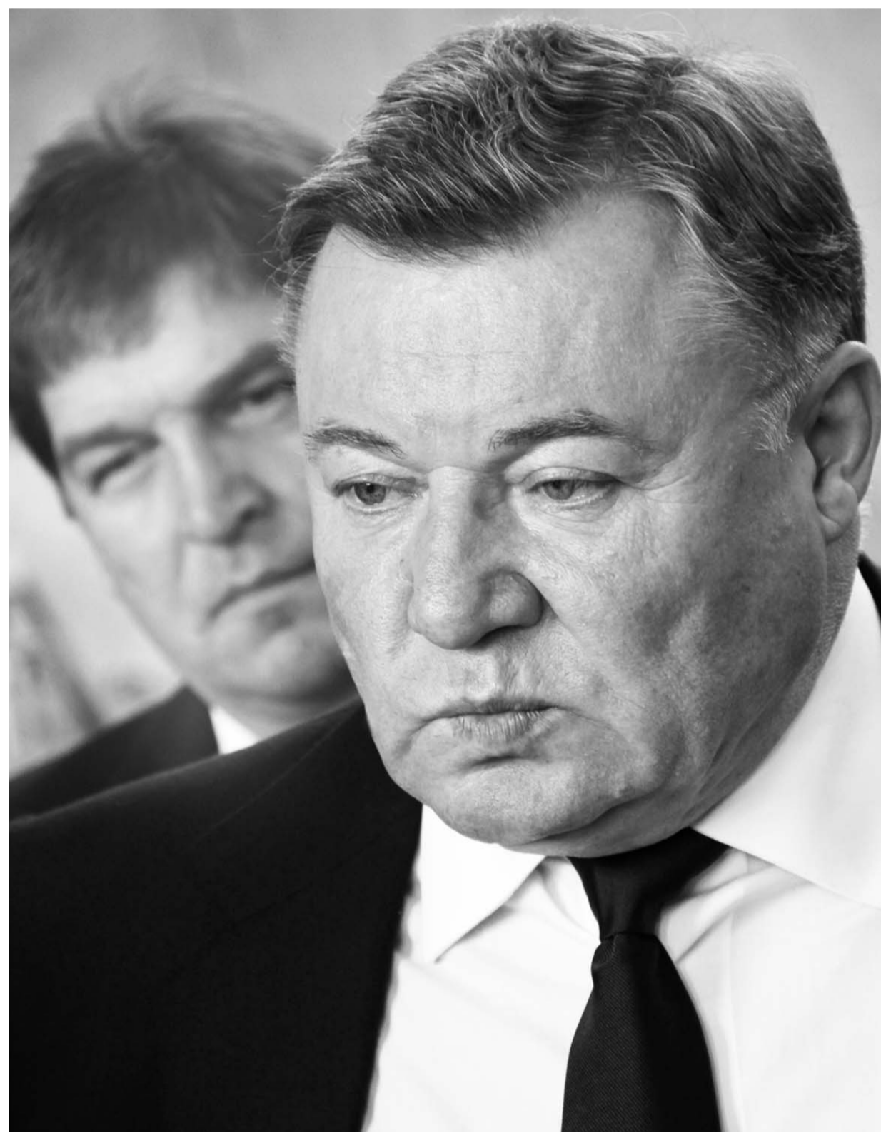
Губернатор Александр Козлов: — При наших объемах производства сахарной свеклы, по хорошему, нам нужен еще один сахарный завод. И мы будем работать в этом направлении

В этом году Залегощенский сахарозавод перерабатывает 120 тысяч тонн свеклы. К следующему сезону инвесторы планируют удвоить мощности. Это позволит увеличить на Орловщине посевы свеклы, которую выращивать сейчас очень выгодно.