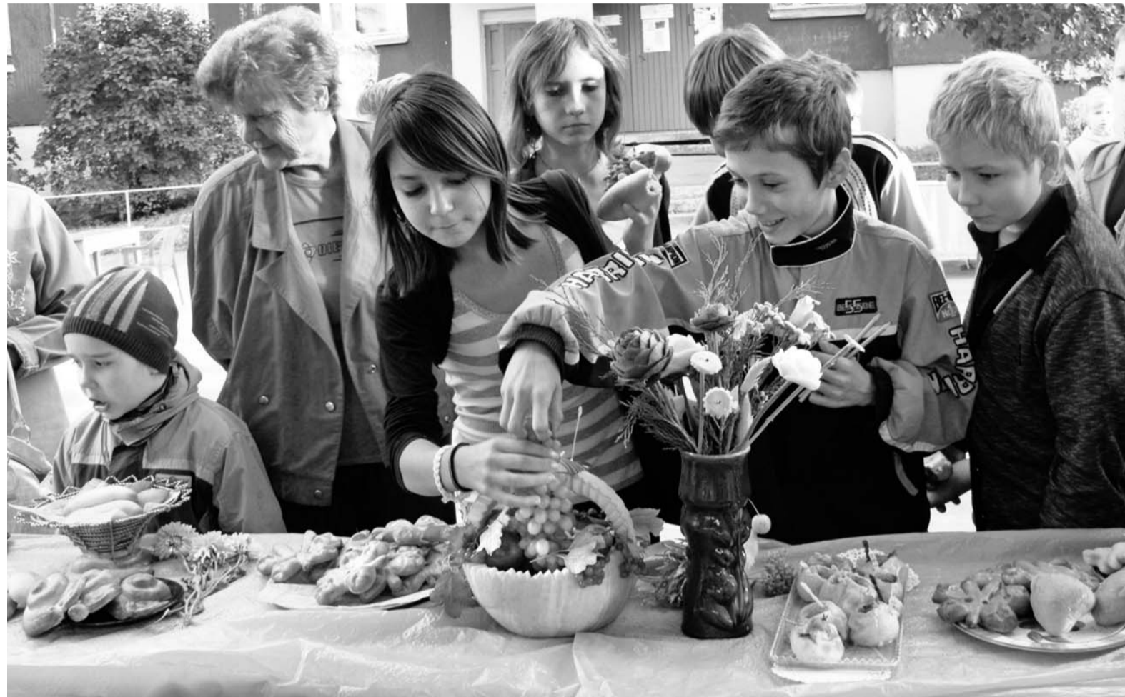
Какой же праздник без застолья!

Благоустройство дворов депутаты считают одним из приоритетных направлений в работе, ведь детям нужно дарить лучше. А лучшая награда за труд взрослых — радостные лица детей.