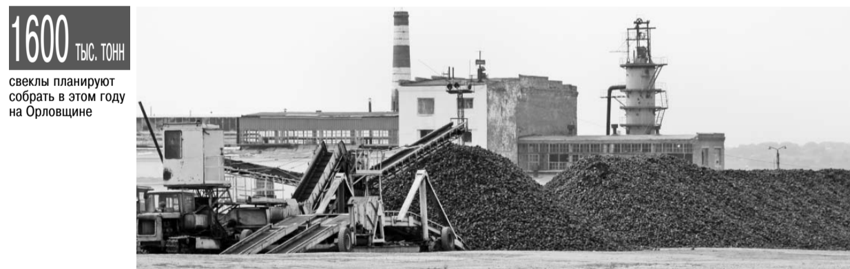
1600 ТЫС. ТОНН свеклы планируют собрать в этом году на Орловщине