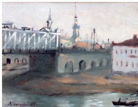
Принцесса русского авангарда Этот почётный титул так навсегда и остался за нашей талантливой землячкой Антониной Софроновой