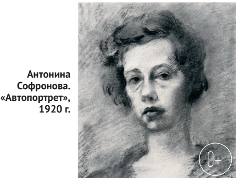
Антонина Софронова. «Автопортрет», 1920 г.

В это трудно поверить, но одна из самых интересных художниц XX века — живописец, график, книжный иллюстратор, талантливый педагог — была на долгое время забыта современниками. Антонина Фёдоровна Софронова прошла долгий, тернистый путь в поисках нового, революционного искусства, ломавшего устоявшиеся каноны 1910—1920-х годов зарождающегося XX века. Она с головой погружалась в новые течения: абстракционизм, кубизм, конструктивизм, позволявшие ощутить полную свободу самовыражения. Осталось позади участие в знаменитых творческих сообществах — «Бубновый валет» и «Тринадцать», пока Софронова не пришла к собственному стилю лирической живописи и графики, развивающему традиции французского постимпрессионизма. А среди истинных ценителей изобразительного искусства за ней так и остался почётный титул принцессы русского авангарда. Произведения этого яркого направления в русском живописном искусстве начала прошлого века быстро разошлись по частным коллекциям. Поэтому каждая из картин сейчас — бесценное сокровище. И только самые крупные художественные музеи могут сегодня похвастать такими автора-