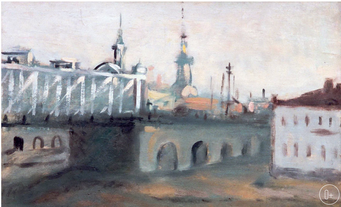
Антонина Софронова. «Мост через Оку», 1929 г.

Но особый интерес, конечно, представляет начальный этап творчества — ранняя графика Антонины Софроновой, в которой она с головой окуналась в новые веяния времени, увлечшись конструктивизмом. Именно эти яркие и необычные произведения книжной графики орловской художницы заполняли в 1920-х годах московские журналы. К это-