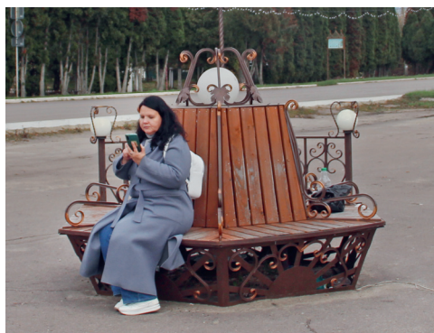
Выходите гулять! В посёлке Глазуновка с каждым годом становится комфортнее