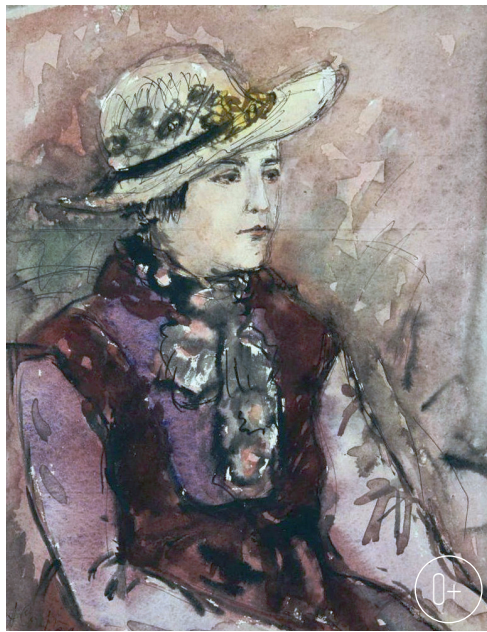
«Портрет актрисы Марии Соколовой-Вилостовской», 1939 г.