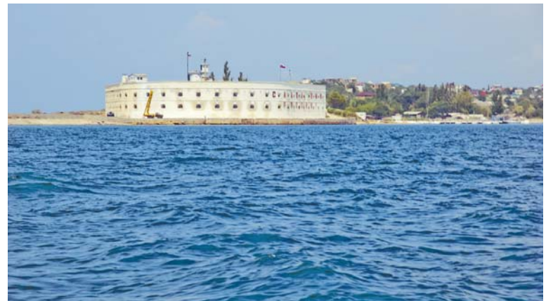
Бастион на входе в Севастопольскую бухту.