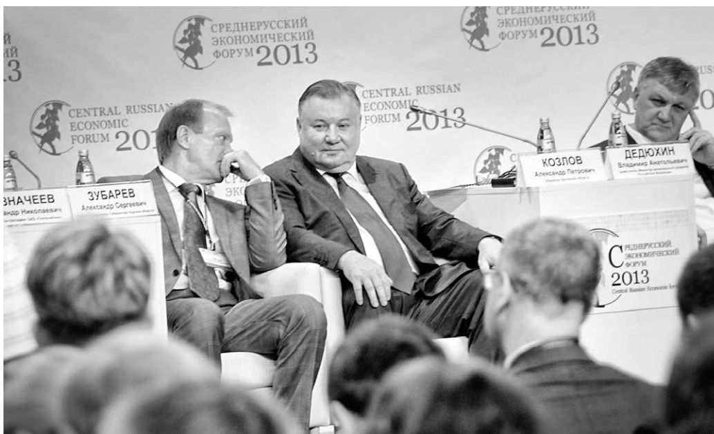
Окончание. Начало на 1-й стр.