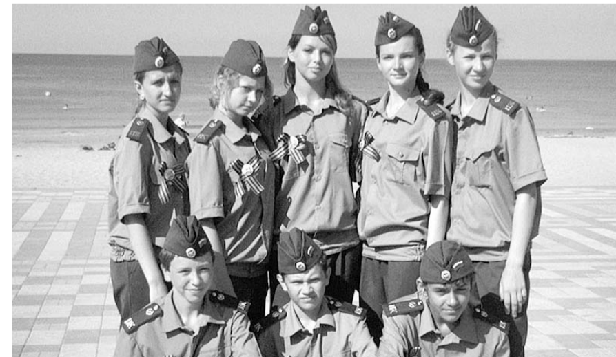
Орловские юнармейцы в «Орленке».

Чем еще был заполнен отдых? Загорали, купа-