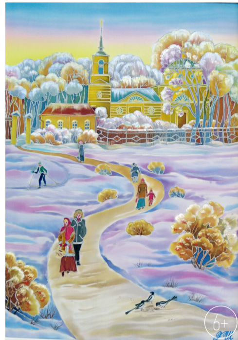
Э. Шенгелия. «Зима в Спасском- Лутовинове»