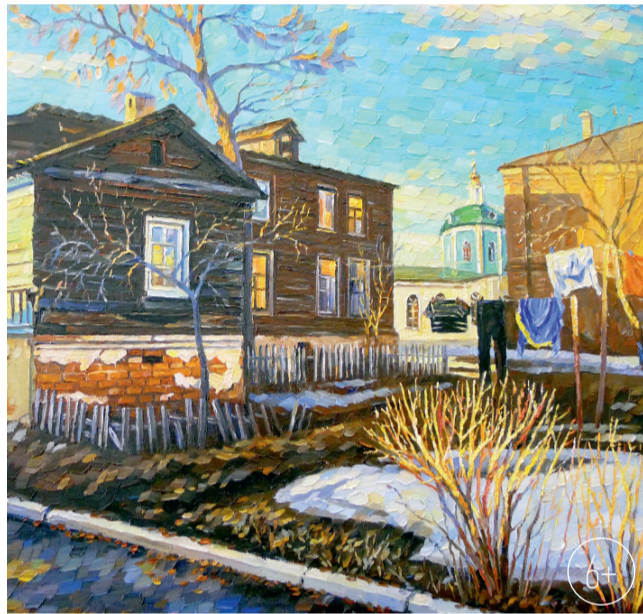
О. Оленина. «Последний снег»