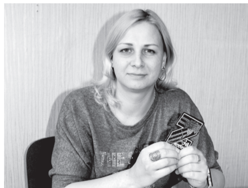
Марина — увлечённый человек!