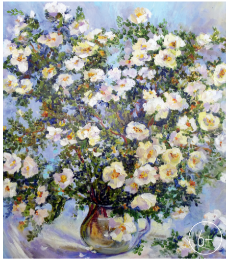
М. Маковеева. «Белый шиповник»

В Орловском областном выставочном центре проходит выставка произведений членов общественной организации художников Орловской области «Товарищество Орловских художников».