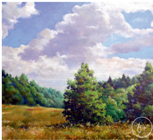
Д. Назаров. «Июль»