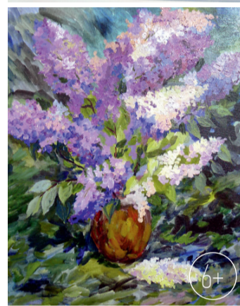
Е. Федоринова- Письменская. «Сирень в лесу»