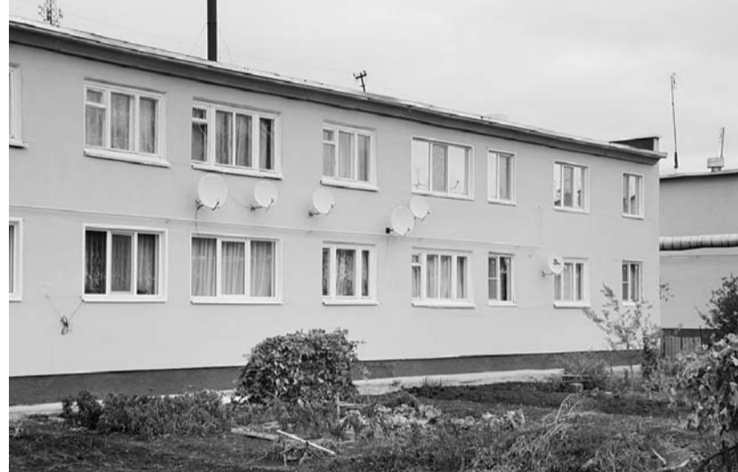
Капремонт, проведенный в одном из домов в Свердловском районе, изменил его до неузнаваемости.

году позволило ликвидировать аварийный жилищный фонд Орловской области, признанный таковым до 1 января 2007 года. Постановлением Правительства Орловской области от 29 декабря 2010 года № 462 утверждена долгосрочная областная целевая программа стимулирования развития жилищного строительства на территории Орловской области