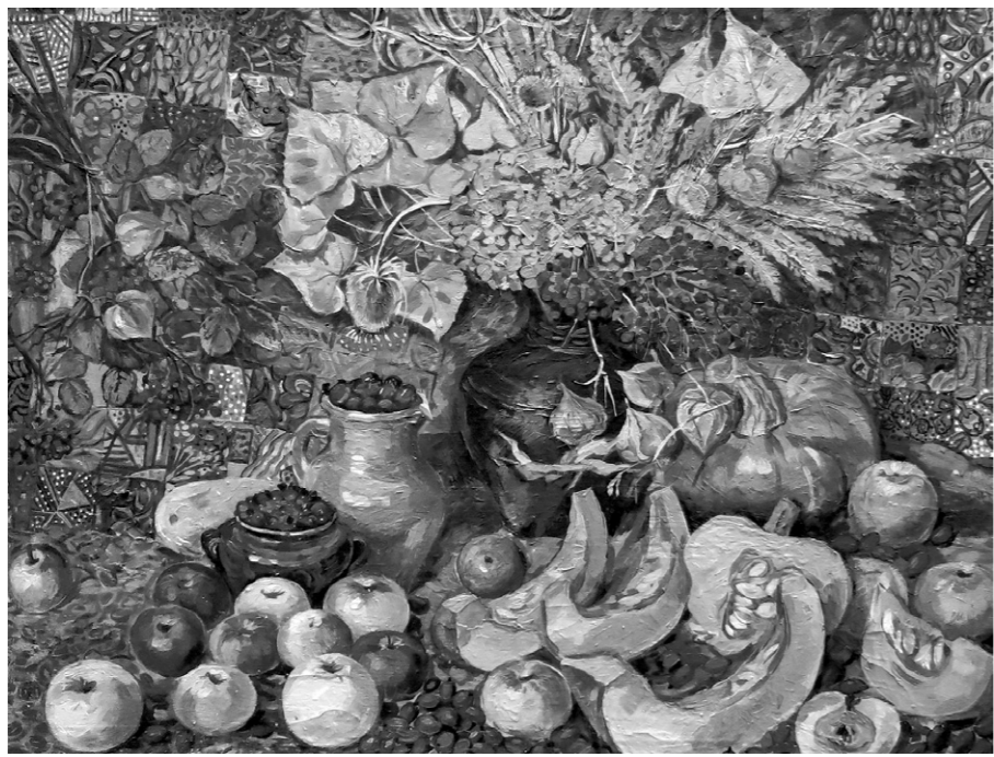
О. Тучина. «Натюрморт»