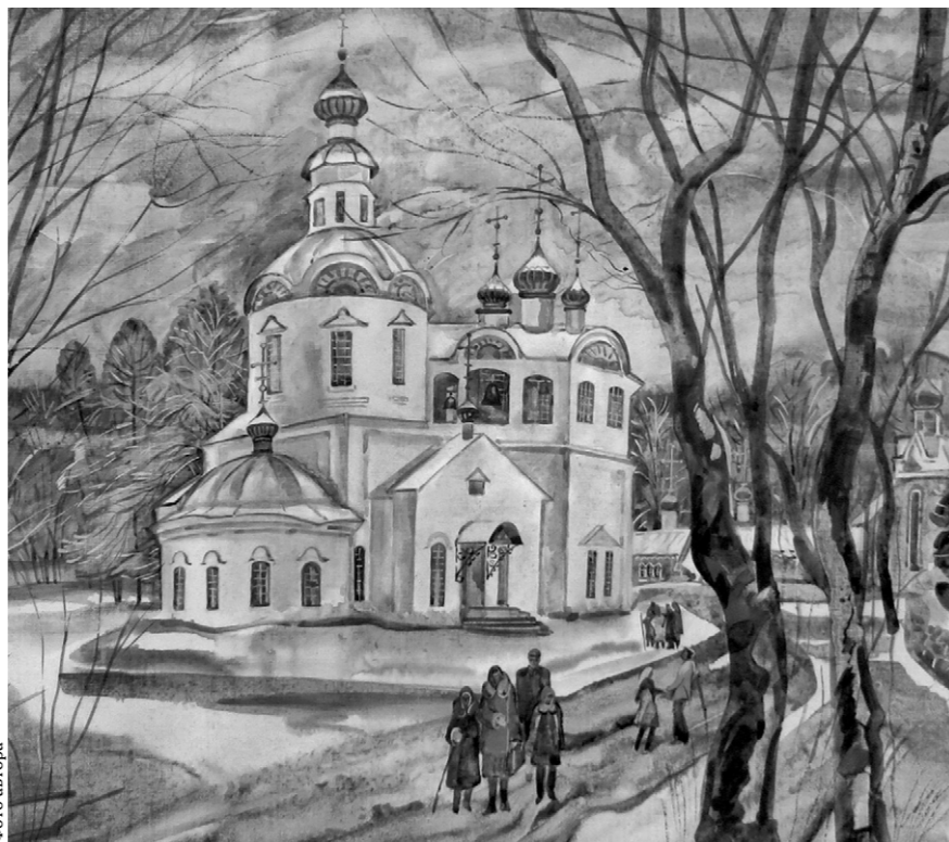
О. Тучина. «Храм Успения Пресвятой Богородицы»

Так называется выставка, которая открылась в областном выставочном центре