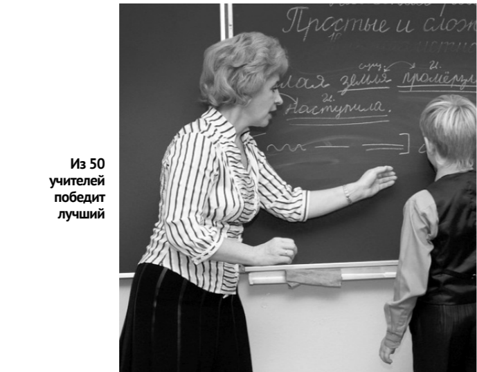
Из 50 учителей победит лучший

— Конкурсы этого года приурочены к празднованию 450-летия Орла, в них примут