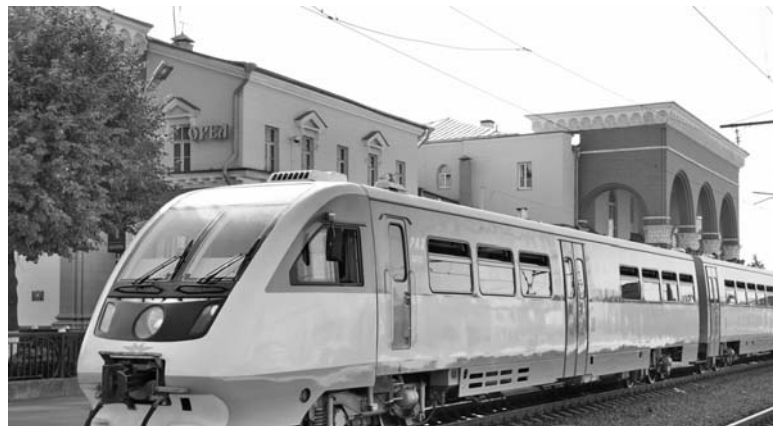
Новый рельсовый автобус (РА-2) скоро отправится по маршруту Орел — Елец.