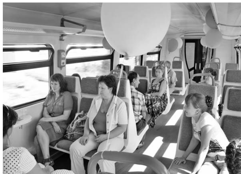
Участники праздничного митинга первыми оценили преимущества нового рельсового автобуса.

Говоря о комфорте для пассажиров, Борис Михайлович не преувеличил. Подмашному уютный салон вагона оборудован мягкими креслами и откидными столиками. На больших окнах есть форточки. Пассажирам РА-2 не придется проделывать «акробатические номера», запрыгивая в вагон с низких платформ: для обеспечения удобной посадки пассажиров предусмотрена выдвигаемая подножка. Сало-