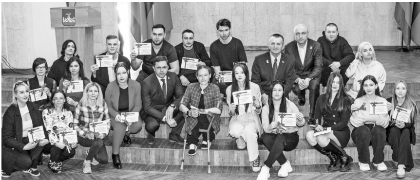
Ключи от квартир получили 22 новосёла

В конце января было заключено 50 муниципальных контрактов. На первичном рынке приобретены квартиры для детей-сирот на сумму свыше 187 млн. рублей. Всего в этом году в Орле на указанные цели планируется направить свыше