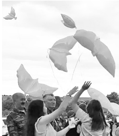
Голуби — символ мира