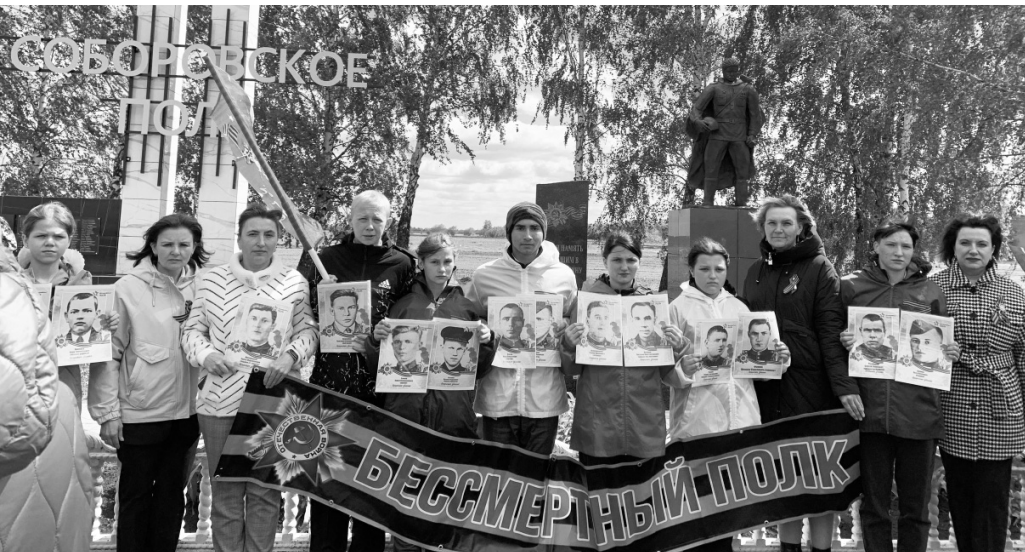
Память о павших живёт

Район Ольховатка — Соборовка, куда был направлен основной удар фашистов, представляет собой одну из вершин Среднерусской возвышенности. В сторону Орла и Курска местность здесь плавно понижается. Овладение этой вершиной давало возможность взять под свой контроль всю местность восточнее, южнее и западнее района Ольховатка — Молотычи, а учитывая, что на этом участке мало лесов, просматривать всё, почти до Курска. Соборовское поле входило составной частью в линию обороны 13-й армии Н. П. Пухова. Она занимала 11 % всей полосы обороны Центрального фронта (32 км из 305 км) и получила почти половину всех артиллерийских полков фронта. В среднем соотношение сил на Курском выступе было в пользу советских войск — 1,3:1. Северку 13-ю армию Н. П. Пухова поддерживала 16-я воздушная армия С. И. Руденко. Фашистское командование сосредоточило на Курском выступе 50 дивизий (16 танковых и моторизованных). Всего на советско-германском фронте в это время находилось 196 немецких дивизий. В полосе обороны Центрального фронта фашисты сосредоточили 22 дивизии (в их числе шесть танковых). Они ата-