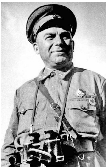
Генерал-лейтенант танковых войск Василий Михайлович Баданов

выпускник Орловского бронетанкового училища им. М. В. Фрунзе гвардии генерал-лейтенант танковых войск дважды Герой Советского Союза Михаил Фомичёв. В ходе сражения советские бойцы проявили героизм и самоотверженность. «К вечеру немцы снова перешли в наступление. Наши бойцы поднялись в атаку. Когда кончились патроны, командир батальона скомандовал: «Ножи!» И уральцы-доброволь-